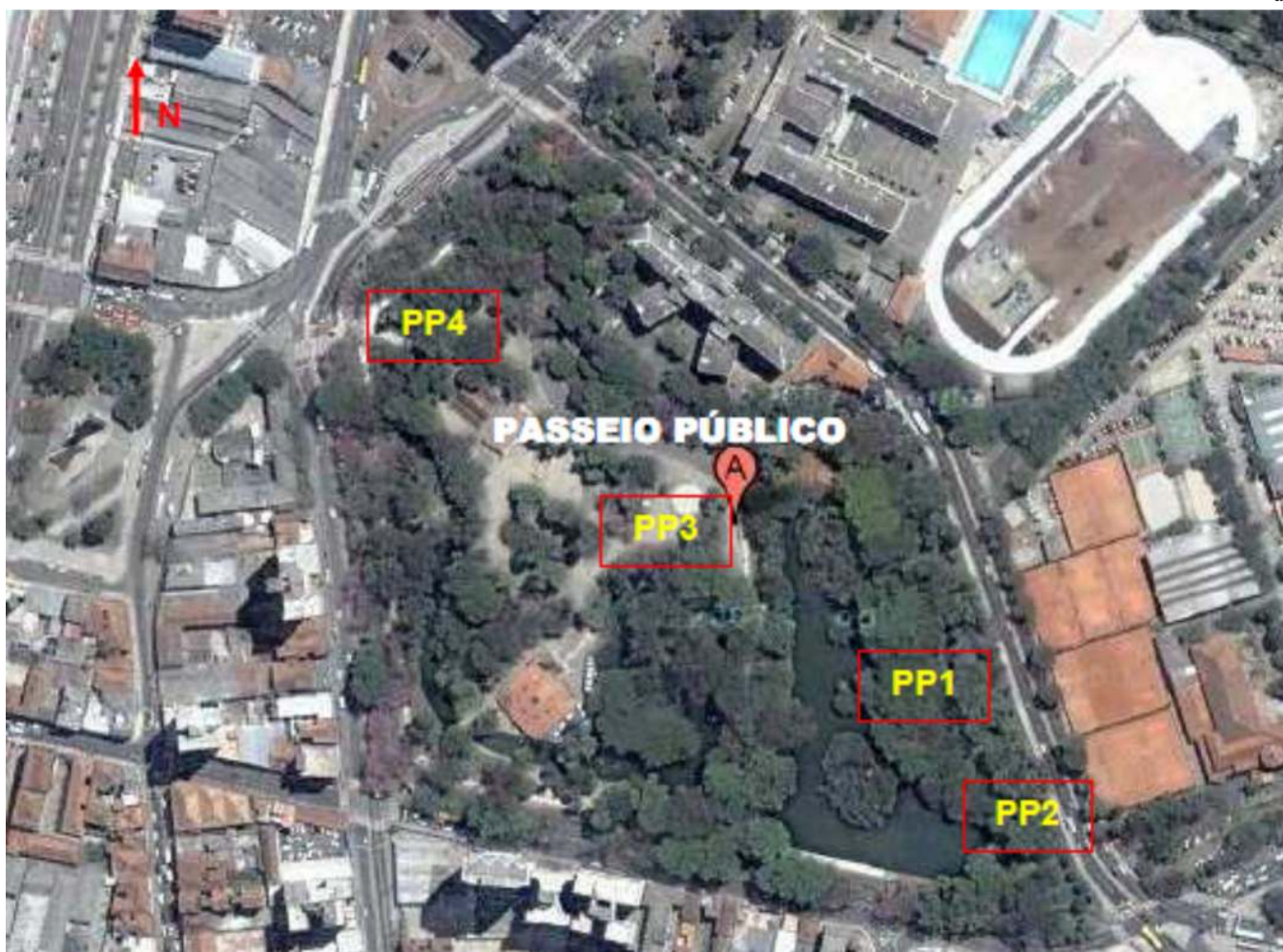
Figura 1S. Vista aérea das áreas de amostragem em Curitiba-PR com indicação da localização dos pontos de amostragem; a) Passeio Público - PP1, PP2, PP3 e PP4; b) Bosque Capão da Imbuia - BCI1, BCI2, BCI3 e BCI4; c) Praça Ouvidor Pardinho - POP1 e POP2. Fonte: Google Maps em 07/08/2008

Universidade Positivo, Rua Prof. Pedro V. Parigot de Souza, 5300, 81280-330 Curitiba -PR, Brasil