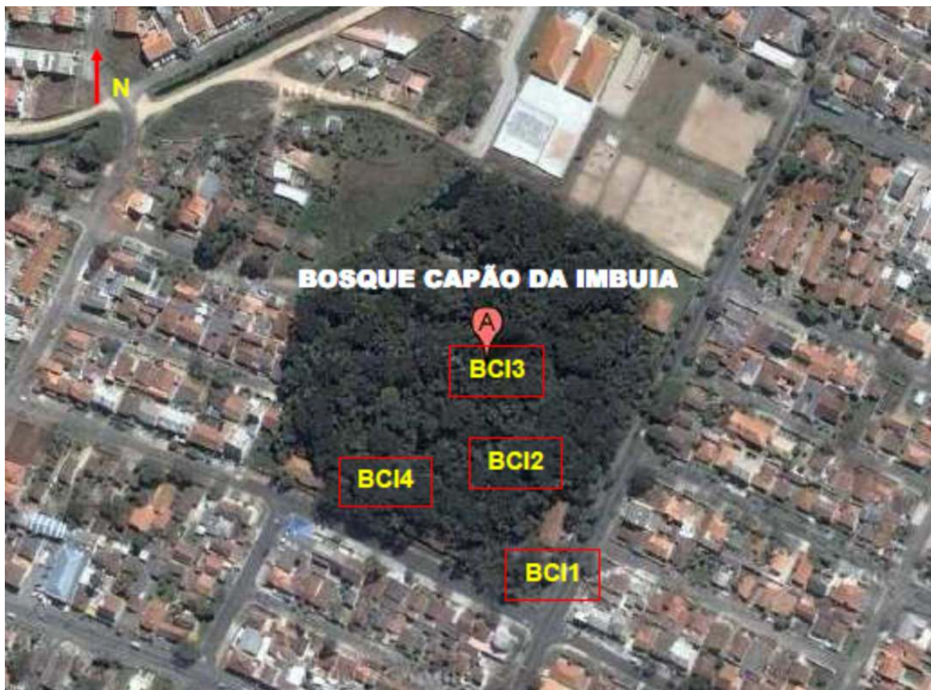
Figura 1S. Vista aérea das áreas de amostragem em Curitiba-PR com indicação da localização dos pontos de amostragem; a) Passeio Público - PP1, PP2, PP3 e PP4; b) Bosque Capão da Imbuia - BCI1, BCI2, BCI3 e BCI4; c) Praça Ouvidor Pardiniho - POP1 e POP2.