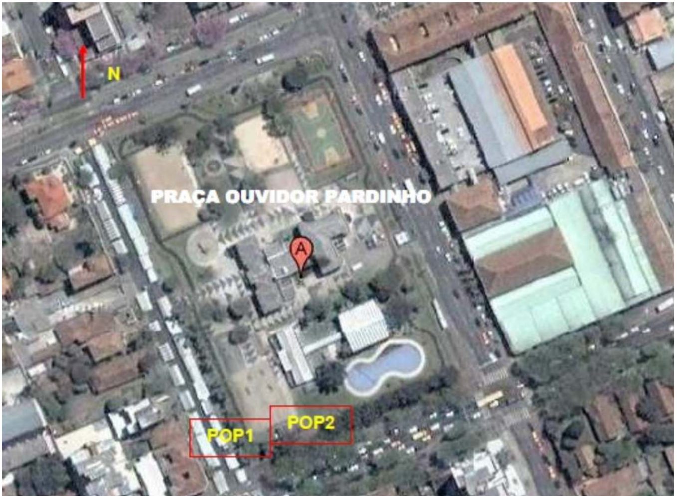
Figura 1S. Vista aérea das áreas de amostragem em Curitiba-PR com indicação da localização dos pontos de amostragem; a) Passeio Público - PP1, PP2, PP3 e PP4; b) Bosque Capão da Imbuia - BCI1, BCI2, BCI3 e BCI4; c) Praça Ouvidor Pardinho - POP1 e POP2.