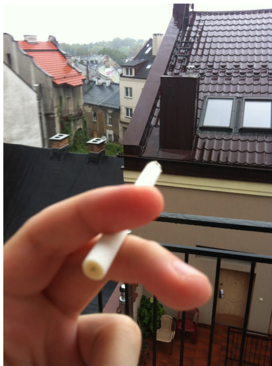
Fot. 1. Stan odrobienia.

mem, gdyż okazje mają to do siebie, że nie trzymają się planów.