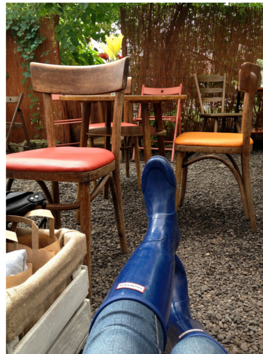
Fot. 2. Stan odrobienia.

Wiesz co, jak mogę sobie tak usiąść po prostu. [...] mimo tego, że mam siedzącą pracę i tam siedzę przy biurku, to chyba znów siedzenie mi się z tym kojarzy. Ale takie, gdy mogę wyciągnąć nogi przed siebie i założyć ręce za głowę. (niedoczasy, K, 28)