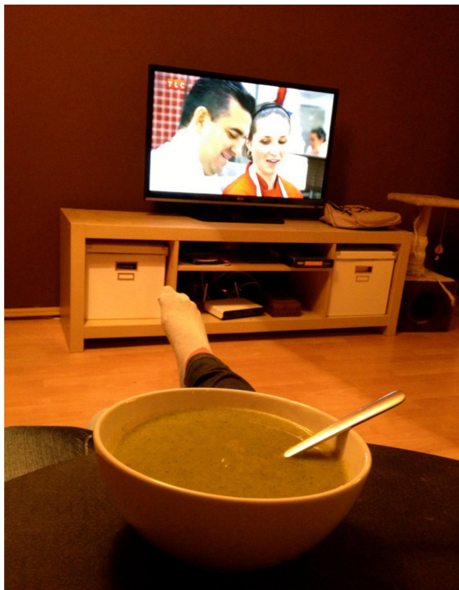
Fot. 3. Nudna odpoczynkowa powtarzalność.

Pomimo ustrukturyzowanej formy praktykowanie czasu wolnego w niedoczasie dopuszcza dozę spontaniczności. Polega ona na przyzwoleniu na odchylenie od planu, na bycie zaskakiwanym przez niespodziewany bieg zdarzeń pod warunkiem, że nowy obrót spraw pozostaje zgodny z potrzebą, ochotą i preferencjami, gdyż w tym zakresie odstępstwa nie są tolerowane. Aby czas wolny był czasem wolnym, między chęcią a działaniem musi zachodzić relacja odpowiedniości. W innym wypadku status czasu wolnego zostaje anulowany.