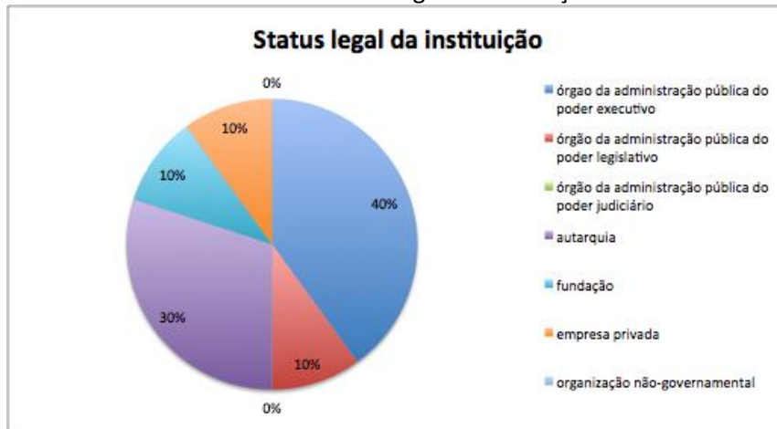
Gráfico 2 – Status legal da instituição