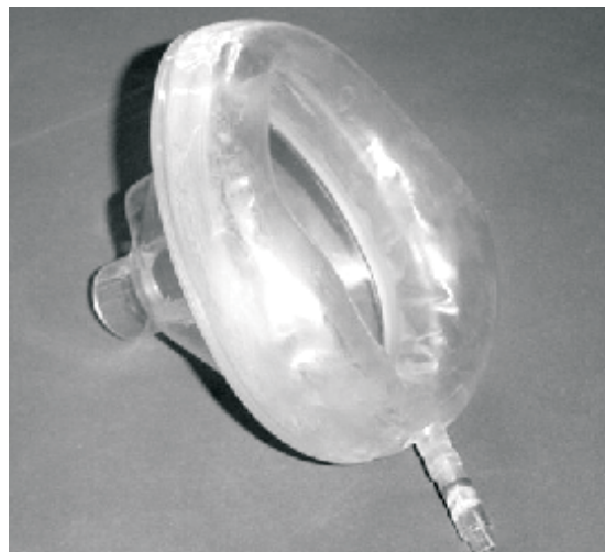
Figura 2 - Máscara facial plástica com borda inflável siliconada

máxima respectivamente. O indivíduo era incentivado pelo avaliador durante toda a manobra para que atingisse esforços máximos. Foram consideradas as pressões máximas sustentadas por no mínimo um segundo. As medidas foram realizadas por no máximo seis vezes, até que fossem obtidos três valores com variação menor que 5%, sendo considerado para a análise o maior valor obtido.