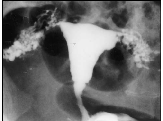
Figura 2. Salpingite ístmica nodosa bilateral.