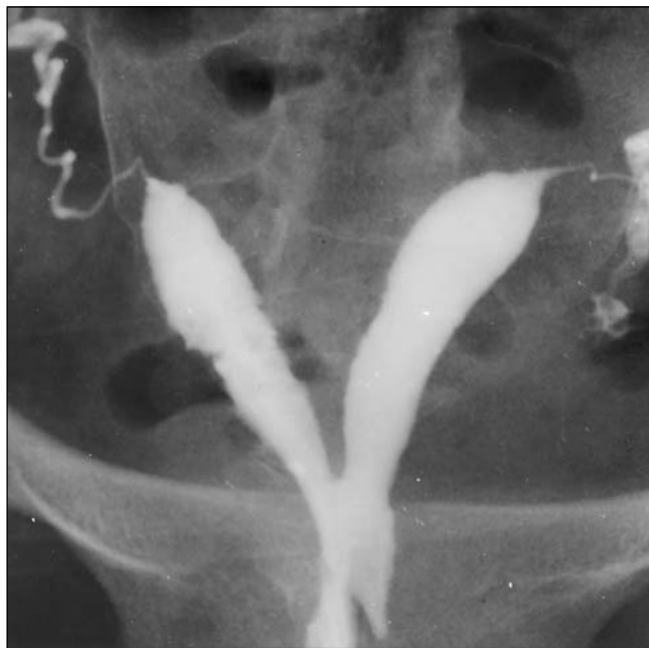
Figura 3. Útero bicorno unicolis.

germes de baixa virulência, como, por exemplo, a Chlamydia trachomatis , responsável por inflamação crônica e silenciosa das trompas, esperaríamos uma prevalência superior dos achados correspondentes à infecção nos exames que se mostraram alterados nas pacientes com infertilidade primária. Como podemos