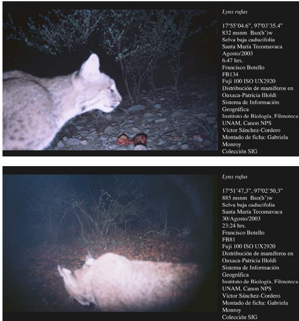
Figura 3 Fotocolectas de gato montés ( Lynx rufus ). El formato de fotocolecta es según Botello (2004).

las 23:23 y 23:24 hrs, respectivamente; en el segundo sitio, se tomó una fotografía a las 6:47 hrs (Fig. 3). La distancia entre ambos sitios es de 6.3 km en línea recta.