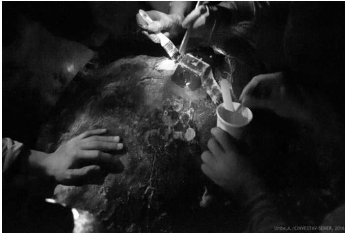
Figura 5. Recubrimiento con pegamento epóxico para mejor adhesión del transmisor al caparazón de una tortuga Carey ( E. imbricata ) / Covering with epoxy adhesive for better adhesion of the transmitter to the carapace of a hawksbill turtle ( E. imbricata )