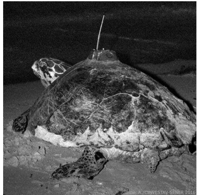
Figura 6. Tortuga Carey ( E. imbricata ) con el transmisor satelital colocado en el caparazon y plastilina epóxica por encima de la fibra de vidrio alrededor del transmisor / Hawksbill turtle ( E. imbricata ) with satellite transmitter placed in the carapace and epoxy plasticine above the fiberglass around the transmitter

burbujas de aire. En ambos procedimientos es importante evitar cualquier contacto del pegamento epóxico con los tornillos y antena del transmisor, así como con cualquier tejido blando de la tortuga.