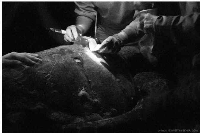
Figura 4. Colocación transversal de cintas de fibra de vidrio al transmisor de una hembra de tortuga Carey ( E. imbricata ) / Transverse placement of fiberglass tapes to the transmitter of a female of hawksbill turtle ( E. imbricata )

debe extender de manera que no se formen grumos alrededor del transmisor y quede un acabado liso. Es importante verificar que no quede ningún espacio vacío sin plastilina entre la superficie de la base del transmisor y el caparazón, así como ningún orificio en la plastilina aplicada al transmisor y a su alrededor. Orificios como los mencionados pueden provocar el desprendimiento del transmisor. La plastilina restante se reserva para los siguientes pasos en la fijación.