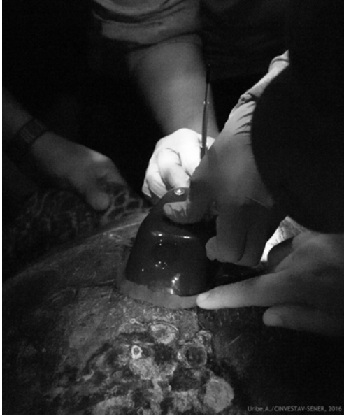
Figura 3. Colocación del transmisor satelital en la zona de fijado del caparazón de una tortuga Carey ( E. imbricata ) / Placement of the satellite transmitter in the fixing area on the carapace of a hawksbill turtle ( E. imbricata )