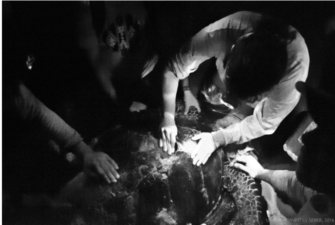
Figura 1. Lijado de la zona de fijado en el caparazón de una tortuga carey ( Eretmochelys imbricata ) / Sanding of the fixing area on the carapace of a hawksbill turtle ( Eretmochelys imbricata )