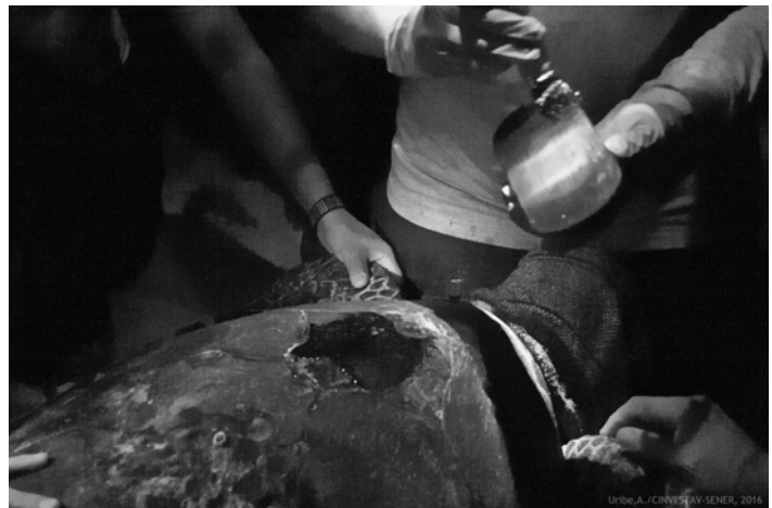
Figura 2. Aplicación de pegamento epóxico en la parte inferior del transmisor y en el área del caparazón de una tortuga carey ( E. imbricata ) donde se colocará el transmisor / Application of the epoxy adhesive on the underside of the transmitter and on the carapace area of a hawksbill turtle ( E. imbricata ) where the transmitter will be placed

Procedimiento para el uso del pegamento epóxico de secado rápido ( e.g. , Marca Devco 5 min): La cantidad de pegamento a utilizar dependerá del tamaño del transmisor a colocar, por ejemplo, el tamaño máximo de uno de los transmisores colocados fue de 150 x 73 mm (Telonics™) y la cantidad de pegamento generalmente utilizada es de 25 ml. Esta cantidad de pegamento se vierte en un vaso de cartón removiendo el pegamento rápidamente con un abatelenguas hasta homogeneizarlo. El pegamento sólo puede ser aplicado antes de que se endurezca, proceso de curación (secado) que tarda alrededor de 10 min, dependiendo de la temperatura y humedad del ambiente. Este pegamento se aplica en la parte inferior del transmisor, después de remover cualquier membrana plástica adherida al transmisor de fábrica y de limpiar la superficie inferior del mismo con alcohol para eliminar cualquier residuo. El mismo pegamento también se aplica en el área del caparazón donde será colocado el transmisor (Fig. 2).