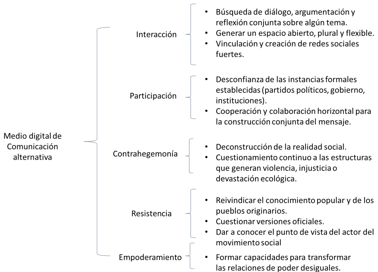
Figura 2. Detonadores para la estructuración del medio digital alternativo.

Un último aspecto que destaca de la forma en la que conciben la participación es que para llevarse a cabo se requiere un involucramiento empático, es decir, para tomar parte de cualquier actividad existe un plano de escucha, confianza, interés y conocimiento que facilita la horizontalidad en la comunicación y la creación de estructuras particulares de colaboración al interior del medio y entre su comunidad de usuarios. Estos valores son los que propician los esquemas participativos en estas experiencias.