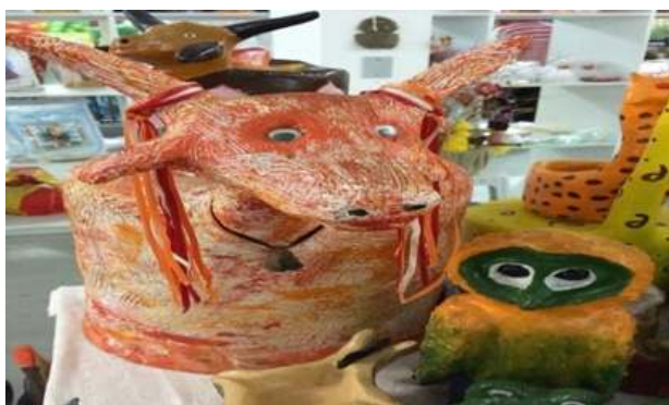
Figura 3: Imagem disparadora: Luminárias de bambu e sisal