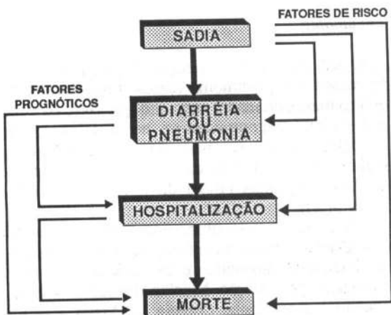
Figura 2. Esquema conceitual de fatores de risco e fatores prognósticos.

Para a análise estatística foi utilizada regressão logística* não condicional. Com esta técnica, foi calculada a razão de produtos cruzados (RPC ou "odds ratios") com intervalos de confiança a 95% (IC); a significância estatística foi avaliada pelo teste de razão de verossimilhança (para variáveis categóricas e para tendência linear). Apesar de na seleção ter sido adotado o emparelhamento, a análise foi realizada com os dados não-emparelhados devido ao volume de perdas o que reduziria substancialmente o número de pares. Como a análise com dados não emparelhados tende a subestimar o risco, este seria, portanto, um viés conser-