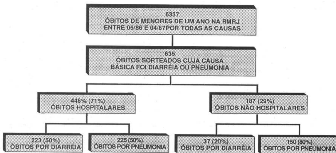
Figura 1. Composição da amostra de casos segundo a causa básica e o local de ocorrência do óbito.

A coleta dos dados foi feita através de dois questionários. O questionário hospitalar foi utiliza-