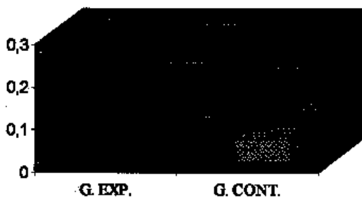
GRÁFICO 1 Ganhos relativos no Pós-teste Imediato

G. EXP. – Grupo Experimental G. CONT. – Grupo de Controle