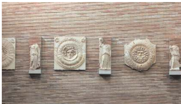
Figura 3. A. Nave principal del Museo; B. Montaje en el fondo de clipeos y cariátides del Foro colonial emeritense.