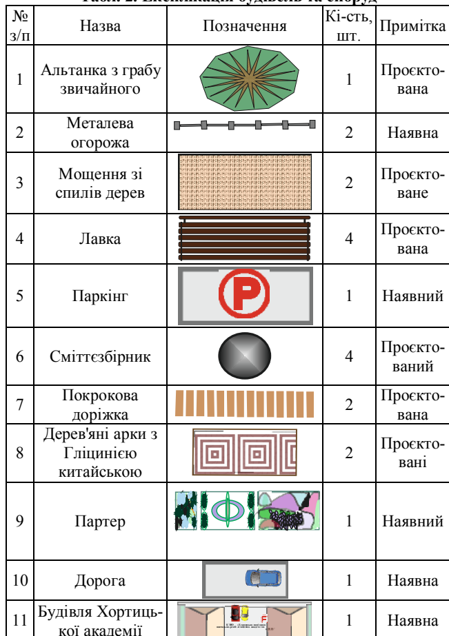
Табл. 2. Експлікація будівель та споруд

Для комфортного відпочинку відвідувачів уздовж прогулянкових доріжок пропонуємо встановити лавки з дерев'яними сидіннями та спинками, які розташовуватимуться у тіні плодкових дерев. Для збирання випадкового сміття біля лавок будуть розміщені урни (табл. 2).