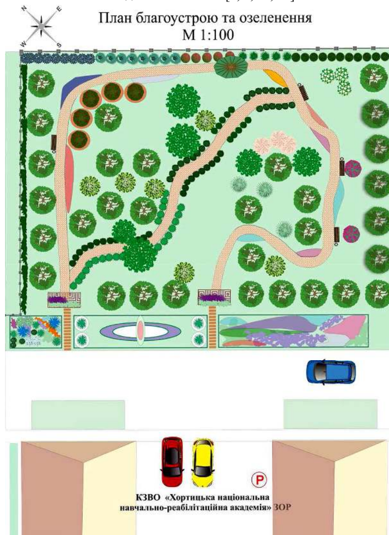
Рис. 2. План благоустрою та озеленення

гальною кількістю 18 екз., окрім 3 екз. маслини вузьколистої ( Elaeagnus angustifolia L.), яка мальовниче впишеться в майбутній пейзаж саду. Видаленню також підлягатимуть і плодіві дерева, які не можна омолодити (8 екз. абрикосу звичайного ( Armeniaca vulgaris ), 2 екз. груші звичайної ( Pyrus communis ), 2 екз. сливи домашньої ( Prunus domestica ) та 4 екз. вишні звичайної ( Cerasus vulgaris ). Для всіх інших дерев рекомендуємо кронування, яке дасть змогу деревам відновити доглянутий зовнішній вигляд і стимулюватиме плодоношення. Ці дерева слугуватимуть основою нового саду (рис. 2). Збереження каркасних насаджень, як основи майбутньої структури нового планування території, часто використовують у проєктах оновлення зелених насаджень як обмеженого, так і загального користування [3, 4, 14, 16].