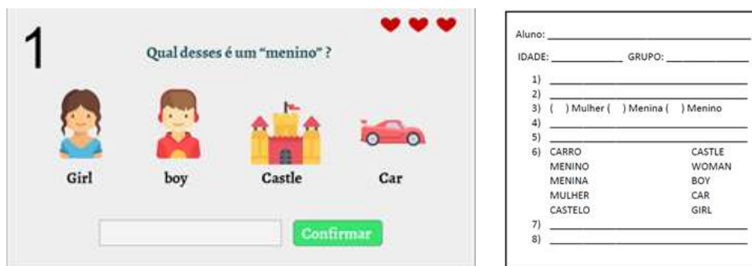
Figura 2. Projeção do protótipo utilizado e folha de respostas utilizada

b) Preparação da experiência: nesta etapa foram utilizados os seguintes materiais: protótipo de baixa fidelidade, computador, projetor de slides e folha de respostas. O protótipo de baixa fidelidade foi elaborado utilizando a ferramenta de apresentações do Google. Uma das telas do protótipo é apresentada na Figura 2. O protótipo foi mostrado utilizando um projetor de slides e para que todos pudessem interagir, foi entregue uma folha de respostas para as atividades propostas durante a experiência. Um exemplo da folha de respostas pode ser observado na Figura 2.