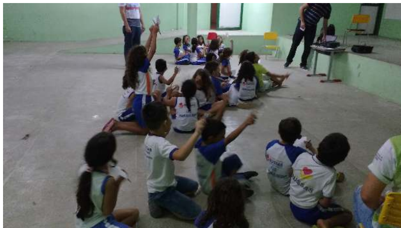
Figura 3. Aplicação da experiência

forma similar a um jogo de memória, onde os alunos deveriam estar atentos às atividades para identificar a resposta correta e lembrá-la posteriormente. Ao início, a turma foi dividida em grupos com o auxílio da professora.