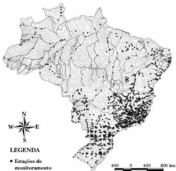
Figura 1. Mapa da distribuição das estações de monitoramento da qualidade da água até o ano de 2007.

Associado ao intenso uso dos recursos hídricos e conseqüentemente à sua poluição, cresce a necessidade do monitoramento das alterações da qualidade ambiental dos corpos d'água. No Brasil, o que se observa é um número restrito de informações a respeito da qualidade da água e o número de estações em operação é pouco expressivo na maioria dos Estados. Há por exemplo, uma diferença significativa entre o número de estações operadas nas regiões Sul e Sudeste em comparação àquelas disponíveis nas demais regiões do país (Figura 1). O que agrava a situação é o fato de na maioria das vezes as variáveis analisadas serem poucas e ineficientes em termos de avaliação do real estado dos recursos hídricos (Braga et al. , 2006).