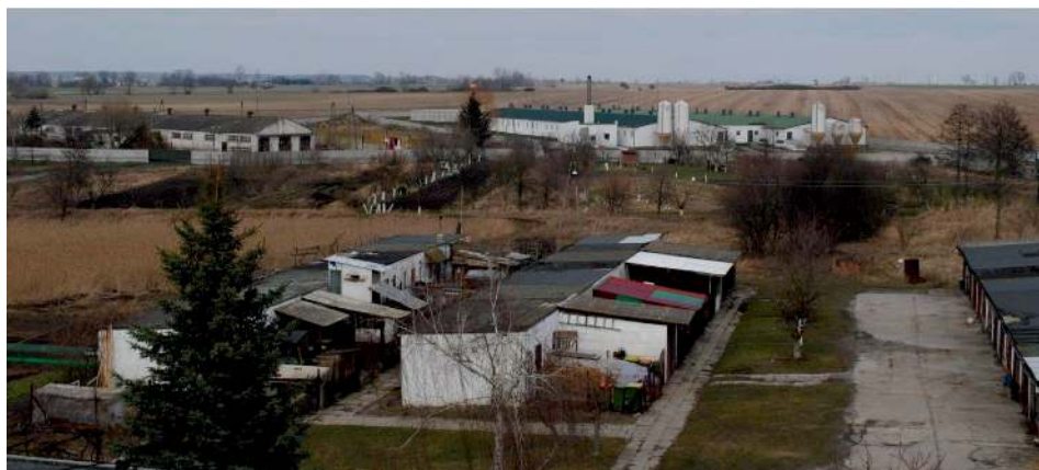
Fot. 2. Stara i nowa zabudowa gospodarcza na terenie popegeerowskim w Ligocie

Ostatni z zakładów włączonych do badania – PGR w Kobierzycku składał się z budynków gospodarczych, takich jak: stodoły, spichlerze, zbiornik małej retencji, dwie hydroformie i budynku bukaciarni. PGR w Kobierzycku to miejsce, które nie zmieniło sposobu zagospodarowania. Aktualnie na obszarze gospodarstwa prowadzi się hodowlę bydła oraz uprawę zbóż. Badania terenowe wykazały, że zasób budynków gospodarczych jest w bardzo złym stanie technicznym, wymagającym jak najszybszej modernizacji. Tereny, które w przeszłości należały do PGR-u w omawianej miejscowości, wcześniej zajmowane przez łąki i pastwiska, obecnie zajęte są przez przydomowe ogródki, w których mieszczą się szklarnie. Na potrzeby tego gospodarstwa stworzono 64 mieszkania. Obiekty te prezentują bardzo dobry stan estetyczno-architektoniczny. Jest to także przykład zaradności mieszkańców i wykorzystania przez nich funduszy unijnych (fot. 3).