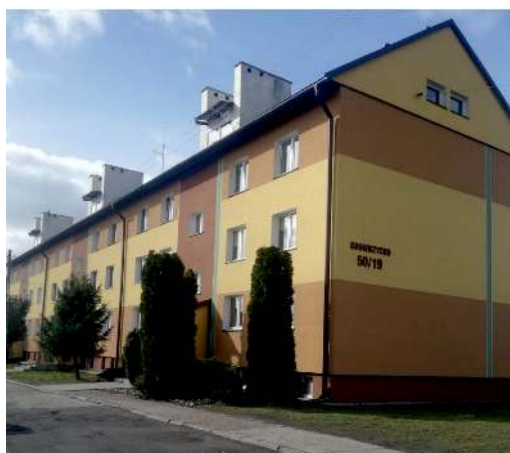
Fot. 3. Zmodernizowana zabudowa mieszkaniowa na osiedlu popegeerowskim w Kobierzycku

Ostatni z zakładów włączonych do badania – PGR w Kobierzycku składał się z budynków gospodarczych, takich jak: stodoły, spichlerze, zbiornik małej retencji, dwie hydroformie i budynku bukaciarni. PGR w Kobierzycku to miejsce, które nie zmieniło sposobu zagospodarowania. Aktualnie na obszarze gospodarstwa prowadzi się hodowlę bydła oraz uprawę zbóż. Badania terenowe wykazały, że zasób budynków gospodarczych jest w bardzo złym stanie technicznym, wymagającym jak najszybszej modernizacji. Tereny, które w przeszłości należały do PGR-u w omawianej miejscowości, wcześniej zajmowane przez łąki i pastwiska, obecnie zajęte są przez przydomowe ogródki, w których mieszczą się szklarnie. Na potrzeby tego gospodarstwa stworzono 64 mieszkania. Obiekty te prezentują bardzo dobry stan estetyczno-architektoniczny. Jest to także przykład zaradności mieszkańców i wykorzystania przez nich funduszy unijnych (fot. 3).