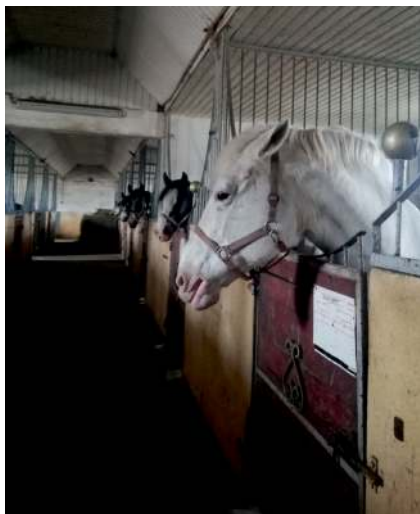
Fot. 1. Zaadaptowanie budynku obory popegeerowskiej na stadninę koni w Januszewicach