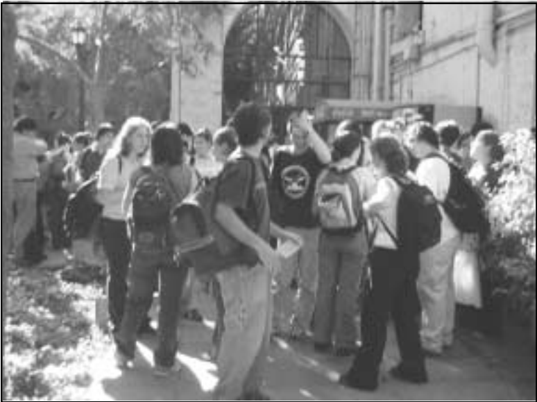
La personalidad y el estilo de aprendizaje de los estudiantes inciden en su desempeño académico y adaptación a la vida universitaria (alumnos de medicina en la primera semana de clases).

El MBTI, a diferencia de otros instrumentos, no mide rasgos de personalidad sino preferencias por uno u otro polo de estas 4 dimensiones psicológicas 14 . Los polos opuestos de la primera dimensión son Extraversion (E) e Introversion (I). Para un individuo con preferencia E, la fuente de motivación está en el mundo externo: en el contacto con las cosas y personas; si su preferencia es I, su motivación se origina principalmente de su mundo interior. En cuanto a la percepción de la información, las personas con preferencia Sensing (S) prestan especial atención a los detalles y aspectos concretos. Aquellas con preferencia Intuition (N), atienden a