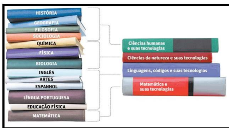
Imagem 2 – Reestruturação no Ensino Médio.

Destaca-se, ainda neste viés, que a politécnica, após a reestruturação, trouxe uma nova disciplina às escolas da rede pública de ensino: Seminário Integrado 4 – SI. O tensionamento das áreas do conhecimentos dobra-se diante do Seminário Integrado, pois este passa a ser a ponte de origem e retorno dos saberes e da materialização dos trabalhos e produção de aprendizagem na politécnica. A disciplina, já supracitada, possui matriz na pesquisa, tornando-se cerne essencial para a construção do conhecimento conectado com o mundo do trabalho, constituindo-se como recurso pedagógico à produção do conhecimento de forma individual e coletiva, uma vez que permite ao estudante, agora considerado pesquisador, acesso à condição de criador, questionador e sujeito da construção do próprio saber.