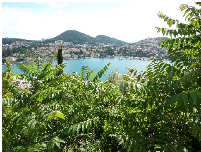
Slike 5. Pogled na Dubrovnik s Tuđmanova mosta, 28. 5. 2014.

U Dubrovačko-neretvanskoj županiji zabilježen je duž cijele obale kopnenoga dijela, a napose na ulazima u gotovo sva turistička mjesta (slika 5.) te na najjužnijoj točki Hrvatske, u mjestu Prevlaka. Najveći broj nalaza zabilježen je u gradu Dubrovnik. Pajasen je zabilježen na više lokacija, a na nekima pokazuje visok stupanj agresivnosti. Potrebno je spomenuti i mjesto Trsteno, gdje nekoliko biljaka pajasena raste i u Arboretumu Hrvatske akademije znanosti i umjetnosti.