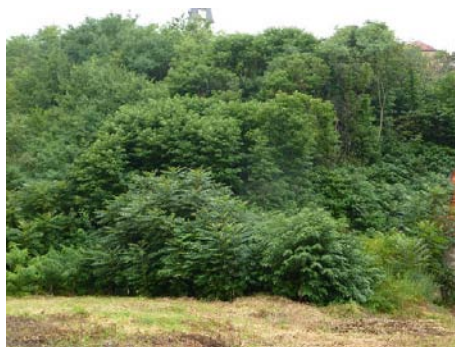
Slika 2. Pajasen uz rub šume iznad građevinskog zemljišta u Iloku, 7. 8. 2014.

Na nekim lokacijama, kao što je Terezino Polje u općini Lukač na području Virovitičko-podravске županije, pajasen je iskazao visok stupanj agresivnosti na vlažnom staništu uz rijeku Dravu, čime je iskazao i visok stupanj prilagodljivosti uvjetima staništa.