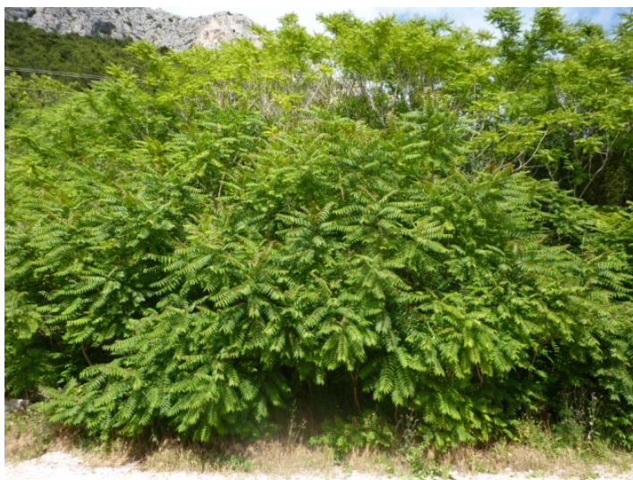
Slika 4. Monokultura pajasena iznad mjesta Brela, 4. 6. 2013.

U Dubrovačko-neretvanskoj županiji zabilježen je duž cijele obale kopnenoga dijela, a napose na ulazima u gotovo sva turistička mjesta (slika 5.) te na najjužnijoj točki Hrvatske, u mjestu Prevlaka. Najveći broj nalaza zabilježen je u gradu Dubrovnik. Pajasen je zabilježen na više lokacija, a na nekima pokazuje visok stupanj agresivnosti. Potrebno je spomenuti i mjesto Trsteno, gdje nekoliko biljaka pajasena raste i u Arboretumu Hrvatske akademije znanosti i umjetnosti.