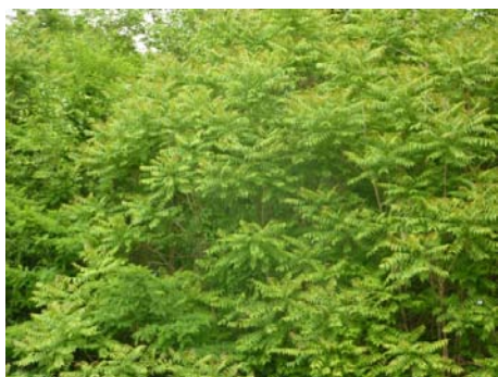
Slika 1. Monokultura pajasena, Aljmaš, 29. 5. 2013

U kontinentalnom dijelu Hrvatske (Grad Zagreb, Zagrebačka, Varaždinska, Koprivničko-križevačka, Krapinsko-zagorska, Međimurska, Bjelovarsko-bilogorska, Karlovačka, Primorsko-goranska, Sisačko-moslavačka, Brodsko-posavska, Požeško-slavonska, Virovitičko-podravaska, Osječko-baranjska i Vukovarsko-srijemska županija) pajasen je proširen na ograničenim područjima i ne predstavlja izravnu opasnost. Ipak, na nekoliko lokacija, kao što su područja gradova Aljmaš (slika 1.), Vukovar i Ilok (slika 2.) zabilježene su snažne populacije s visokim stablima i obiljem sjemenja i mladih izdanaka. Na tim područjima pajasen preuzima prostor na štetu autohtonog bilja te pokazuje tendenciju intenzivnog daljnjeg širenja.