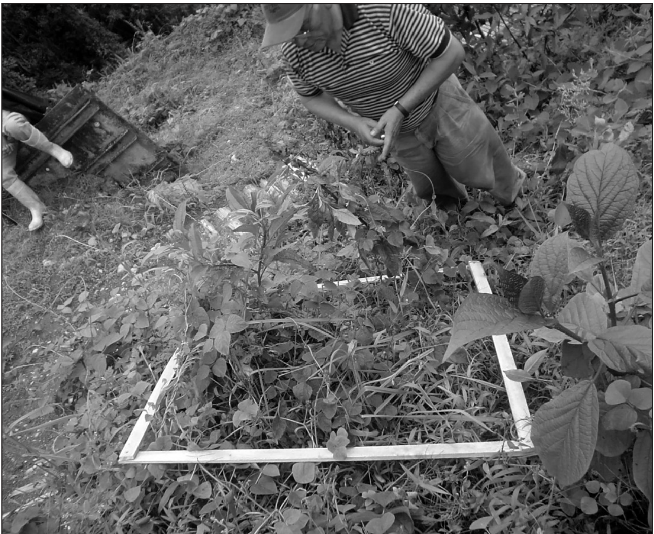
Figura 2. Área Mínima, conteo e identificación.

En una segunda visita se realizó el conteo de las especies herbáceas dentro del Derecho de Vía, utilizando el método del Área Mínima (Barbour, Burk & Pitts, 1973) a fin de hacer el análisis cuantitativo de la flora que se ha restablecido después de la perturbación producida, incluyendo las tres especies sembradas Phaseolus polyanthus (gualea), Paspalum sp. (nudillo) y Panicum polygunatum (cola de conejo), por recomendación de la Fundación Jatun Sacha (Figura 2).