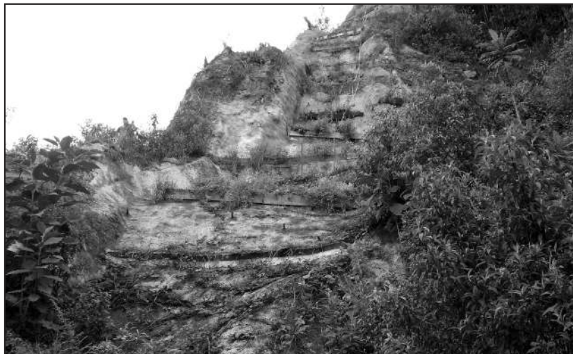
Figura 4. Fase de mantenimiento del oleoducto.

En el conteo de las especies herbáceas dentro del DDV, se observó que la flora en el sitio perturbado se había restablecido. Entre las especies de plantas encontradas se incluyen las tres especies sembradas Phaseolus polyanthus (gualea), Paspalum sp. (nudillo) y Panicum polygynatum (cola de conejo). Las especies que se encuentran con más frecuencia son aquellas que corresponden a la familia de las Asteraceae, seguido de las Poaceae y luego las pteridofitas, representadas por los helechos.