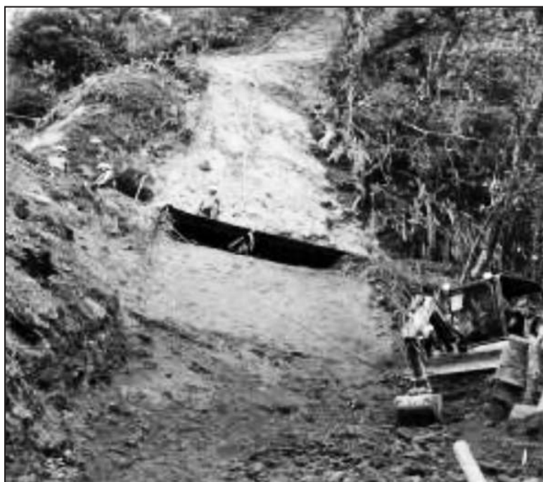
Figura 1. Obra de ingeniería en fase de construcción.

En este lugar se realizaron obras de ingeniería a fin de colocar la tubería del Oleoducto de Crudos Pesados (OCP), ejecutar aseguramientos y sostenimiento de la misma, Esta actividad antrópica provocó un gran impacto en el ecosistema, específicamente en la flora y la fauna del lugar (Figura 1).