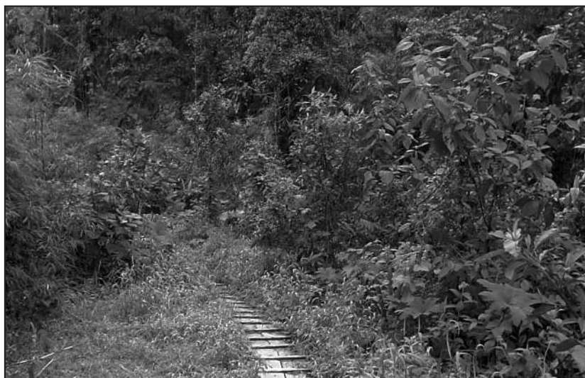
Figura 5. Respuesta de la vegetación, después de la perturbación.

A pesar de que existió un gran impacto negativo para la flora y la fauna, después de tres meses de haber concluido la obra de ingeniería se observó que la vegetación se ha restablecido con gran vigor, porque el número de especies herbáceas encontradas en los espacios abiertos es mayor que las encontradas en el interior del bosque (Figuras 4 y 5).