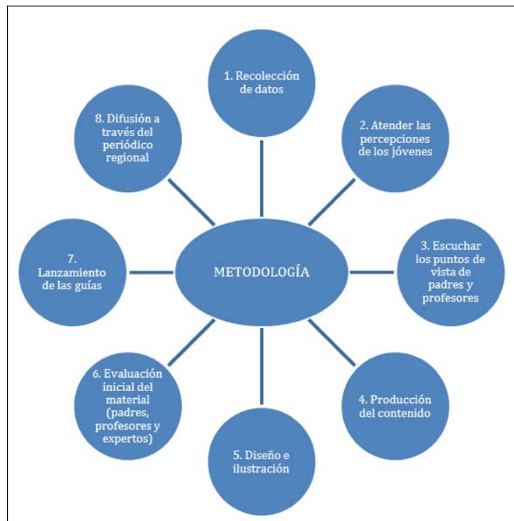
Figura 2. Metodología del proyecto.

El proyecto y las guías también han sido presentados en congresos nacionales e internacionales, en es-