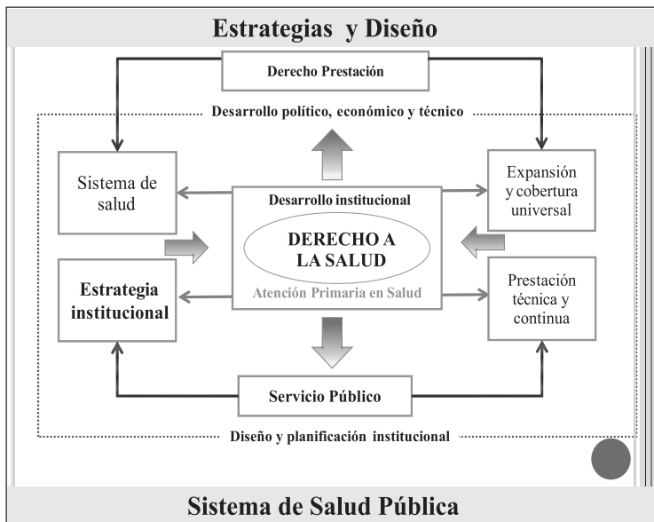
Esquema 2. Estrategias para la reforma de un sistema de salud