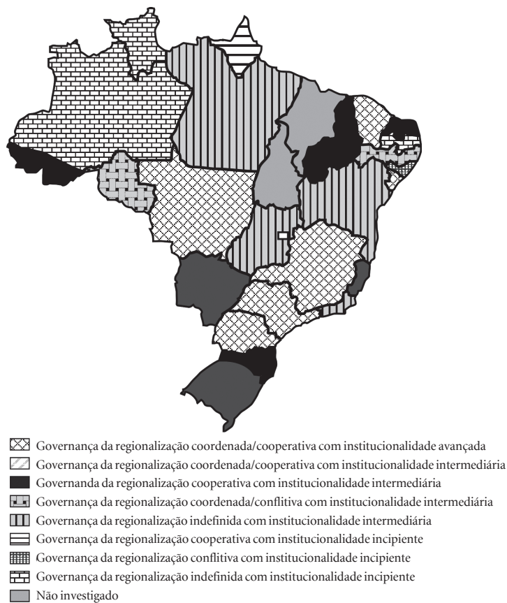
Figura 1. Ideologias e objetos predominantes no processo de regionalização da saúde nos estados – Brasil, 2007 a 2010.

Alguns estados brasileiros, por exemplo, foram conformados ainda no período colonial e apresentam processos muito antigos de regionalização na saúde, iniciados na primeira metade do século passado, incluindo a conformação de estruturas de representação regional das Secretarias de Saúde (tais como Minas Gerais, Rio Grande do Sul, São Paulo, Bahia e Pernambuco). Outros foram formados mais recentemente, sendo sua identidade estadual ou regional ainda muito incipiente. Neste caso, ressaltam-se: o Rio de Janeiro, que se constituiu em 1975 por meio da fusão entre o estado da Guanabara (antigo