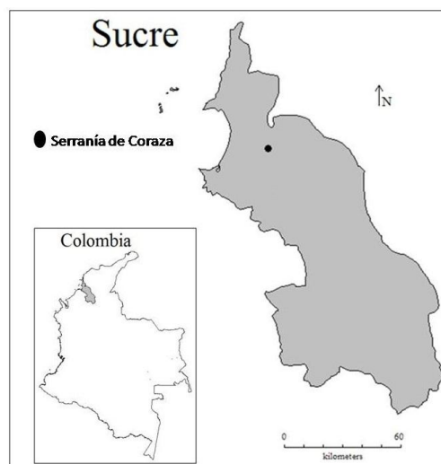
Figura 1. Zona de recolecta de escorpiones en la Serranía de Coraza, Colosó-Sucre

Por primera vez se registran cuatro especies de escorpiones (Fig. 2) para el departamento de Sucre: Opisthacanthus elatus (Gervais, 1844), Tityus tayrona Lourenço, 1991, Tityus asthenes Pocock, 1893 y Ananteris columbiana Lourenço, 1991, ampliando de esta manera el conocimiento de su distribución en Colombia. Los especímenes se encuentran depositados en el Laboratorio de Entomología de la Universidad de Sucre y en la colección de insectos del Laboratorio de Entomología de la Pontificia Universidad Javeriana.