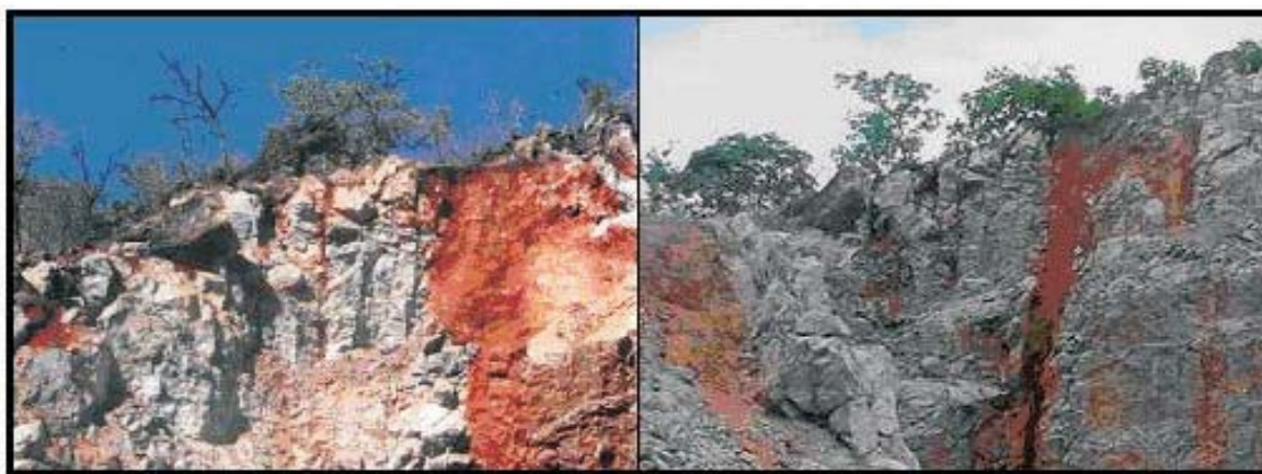
Figura 2 – Borda da planície com presença de rochas calcárias do Grupo Tocantins recobertas por Mata Seca. O local atualmente é usado para extração de calcário.

O horizonte A possui teores médios a altos de P, e teores de carbono elevados, bem como Ca e Mg, pelo efeito da ciclagem sobre material calcário (RIBEIRO et al., 1999), além de apresentar evidência de elevada atividade de argila pela CTC total, mas não possui características de fendilhamento típicos de solos com argila de atividade alta (Quadros 1 e 2).