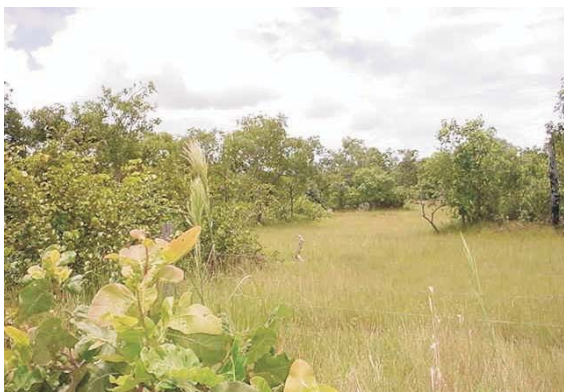
Figura 3 – Área de Campo de Murundus (Varjão Sujo). Nos setores entre murundus predominam gramíneas, e sobre os murundus, local mais bem drenado, ocorrem espécies lenhosas.

Figure 3 – ‘Murundus’ field (‘Varjão Sujo’ - small hills). Grasses dominate the sectors between ‘murundus’. Over the ‘murundus’, in well-drained soils, there is occurrence of woody species.