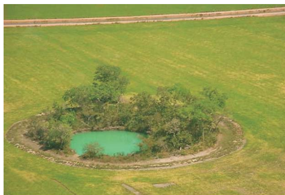
Figura 5 – Dolina em área de cultivo de arroz, formada pela subsidência recente (colapso) de uma Ipuca. Figure 5 – A sinkhole in rice crop area, formed by the recent collapse of an ‘Ipuca’.

Outro aspecto a se considerar é a subsidência das Ipucas por drenagem artificial e excessiva dos solos, induzindo a mineralização de matéria orgânica, rebaixamento do lençol freático e colapso do solo. Todos os fatores anteriormente mencionados podem atuar simultaneamente na área de ocorrência de Ipucas.