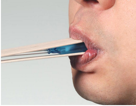
그림 1. 최대 입술 강도 측정 Figure 1. Measurement of maximal lip strength