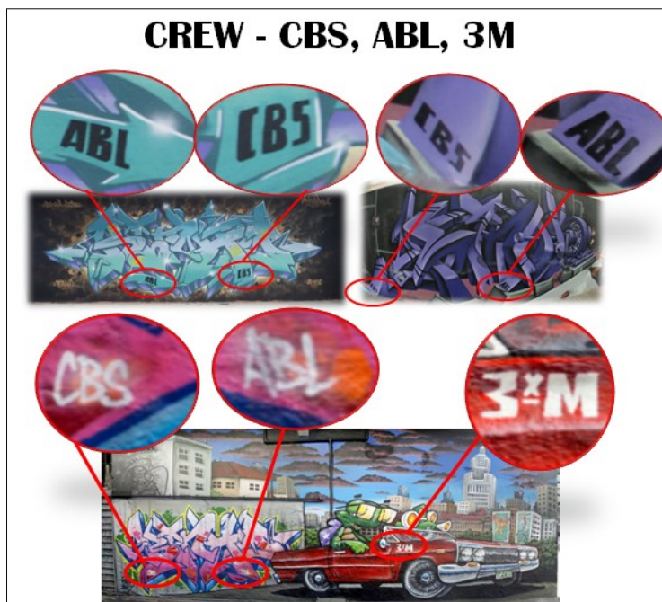
Figura 1 – Inscrições de Crew nas obras grafitadas

o uso de elementos que tenham como referência o mundo digital e que foram apropriados pelos grafiteiros: hashtag , endereço eletrônico, links etc. Outros valores que também incrementam a descrição do graffiti podem ser incorporados, como os aspectos da semiótica aplicada, em conjunção com a sintaxe da linguagem visual (proporção, cores, linhas, volume, suporte etc.), bem como aspectos semânticos, no que dizem respeito ao estilo utilizado pelo grafiteiro ou pelas Crew (registros representados por siglas que os grafiteiros deixam junto às obras como forma de demarcação territorial). Na Figura 1 é possível identificar as Crew presentes na imagem.