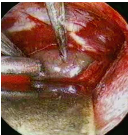
Figura 2. Imagen endoscópica de la lesión tumoral.