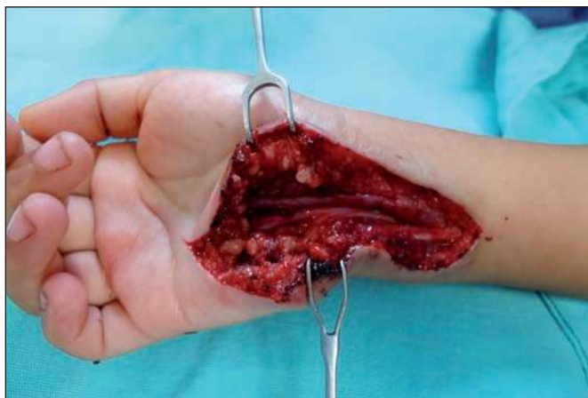
Fig. 4. Reconstrucción microquirúrgica de la arteria cubital mediante un puente venoso término-terminal.

a cabo la reconstrucción microquirúrgica término-terminal de la arteria cubital con nylon 10-0 mediante puntos simples (Fig. 4). Verificamos el adecuado flujo sanguíneo a través de la anastomosis bajo visión directa con microscopio, realizando pruebas de permeabilidad. Finalmente, afrontamos la incisión por planos y colocamos una férula en posición funcional, dando por terminado el procedimiento quirúrgico sin complicaciones.