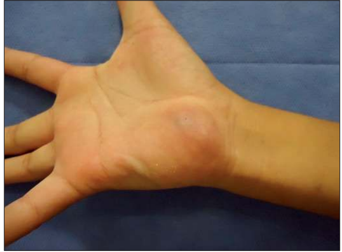
Fig. 1. Aspecto clínico de la tumoración en región hipotenar de la mano derecha.

Con el paciente en sala de operaciones, bajo los efectos de anestesia general balanceada y con uso de isquemia con presión de 180 mmHg en antebrazo derecho,