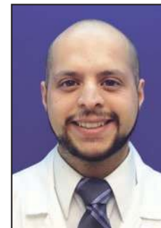
Aguilera Salgado, A.

Aguilera-Salgado, A.*, Gargollo-Orvañanos, C.**, López-Mendoza, J.***, Arrieta-Joffe, P.****, Palafox-Vidal, D.****