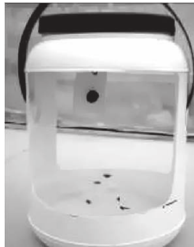
Figura 1. Trampa plástica blanca cebada con volátiles y con agua jabonosa en el fondo.

Preferencia de hembras por estructuras de la planta de papa. Un 44% de las hembras vírgenes de T. solanivora prefirieron el brazo del olfatómetro conteniendo las flores con respecto a las demás estructuras evaluadas y al control, aunque estas preferencias no mostraron diferencias estadísticas (Tabla 1). Para el tiempo de permanencia de las hembras en cada uno de los brazos del olfatómetro, sí se observaron diferencias estadísticas donde hubo una preferencia mayor de las hembras por permanecer en el brazo tratado con tubérculos de papa (Tabla 1).