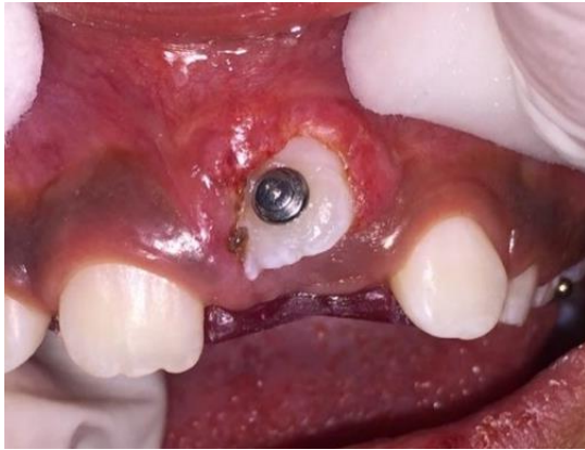
Figura 7. Cementación del botón en la cara vestibular del órgano dental 21

diagnóstico presuntivo basado en elementos de diagnóstico. Si no se produce una erupción espontánea, la elección quirúrgica es la exposición del diente y la tracción ortodóncica de los dientes retenidos.