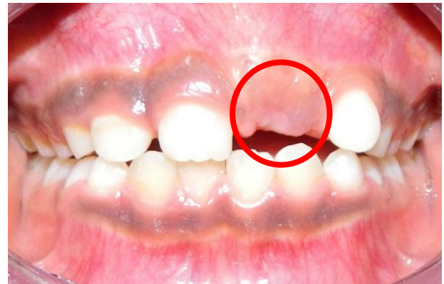
Figura 1. Órgano dental número 21 ausente clínicamente.

El examen clínico reveló la ausencia del incisivo central superior izquierdo (Figura 1). La radiografía panorámica confirmó la retención del incisivo central superior izquierdo con orientación normal, por la obstrucción con un diente supernumerario ubicado en un espacio entre el diente número 21 y 22 (Figura 2).