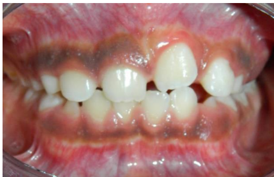
Figura 9. Avances después de 3 meses de uso del aparato de ortodoncia removible.