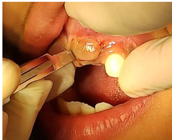
Figura 5. Incisión liberatriz del diente número 21.