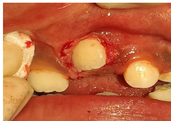
Figura 6. Exposición del diente número 21.

Se utilizaron ligas de fuerza ligera de 2 ½ oz, las cuales fueron medidas con un dontrix para medir la fuerza de tracción que se estaría aplicando con el uso del aparato removible, se le dieron instrucciones de uso al paciente y a sus padres, y se recomendó utilizar el aparato mínimo 16 horas al día (Figura 7).