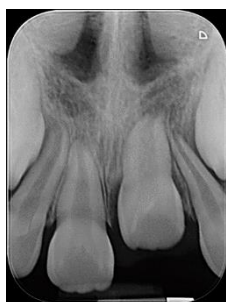
Figura 4. Radiografía periapical de incisivos dentales superiores 2 meses después de la extracción del diente supernumerario.

Una vez que se realiza la exposición del diente, se cementa un botón en la cara vestibular del mismo y se coloca un aparato de ortodoncia removible de base acrílica cubriendo el paladar duro y alambre de acero inoxidable con ganchos circunferenciales en los primeros molares permanentes y ganchos de bola entre los molares deciduos, así como un gancho adicional para sujetar la liga el cual se une al botón de la cara vestibular del diente 21, aplicando una fuerza de tracción ligera para posicionar el diente en el arco.