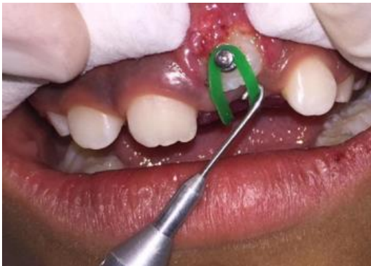
Figura 8. Medición con dontrix de la fuerza de tracción aplicada.