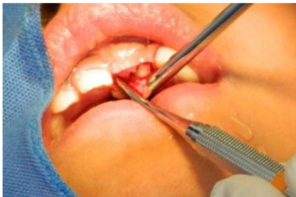
Figura 3. Diente supernumerario expuesto quirúrgicamente.

Meses después de la extracción del diente supernumerario, el diente número 21 aun no erupcionaba pese a que radiográficamente se observa que había avanzado en la guía de erupción (Figure 4). Derivado de esto, se decide hacer la exposición quirúrgica del elemento retenido para su posterior tracción ortodóntica (Figure 5 y 6).