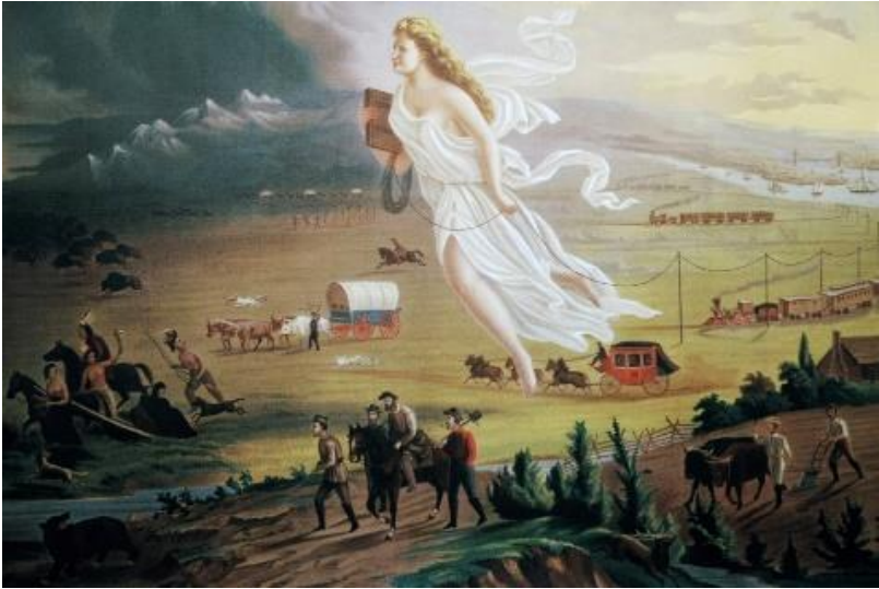
Illustration 1: Painting “American Progress” (Gast 1873)

they enter. They seem to have no precursor in the context which they penetrate, they diffuse indeed like a gas and connect to nothing pre-existing, building no hybrids with the context but simply replacing what has been there before. The pre-existing can only flee.