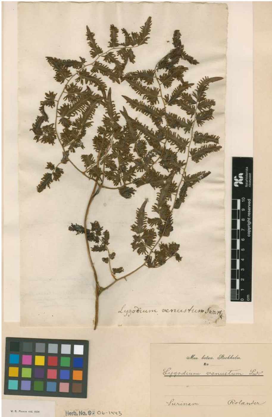
Fig. 2. Espécimen original Rolander s.n. (S 06-1443), seleccionado aquí como lectotipo de Lygodium venustum Sw., depositado en el Swedish Museum of Natural History. Figura en color en la versión en línea http://www.ojs.darwin.edu.ar/index.php/darwiniana/article/view/674/662