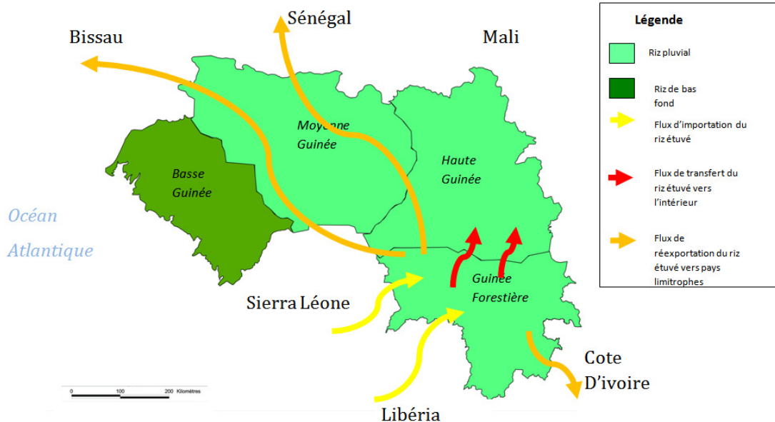
Carte n° 1 : Cartographie des flux régionaux de commerce du riz

limitrophes des pays étudiés sans données quantitatives (carte 1).