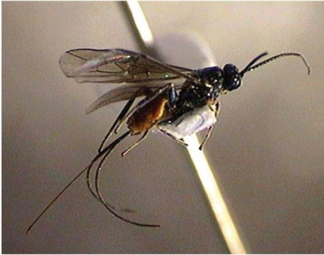
Braconidae con ovipositor largo. Braconidae with a long ovipositor.