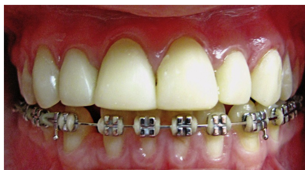
Figura 4 Tratamiento restaurador culminado con cofias de resina en centrales, laterales y caninos.

Se realizó control al mes y al año, se observaron carillas en buen estado y buena salud periodontal.