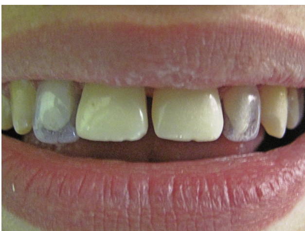
Figura 3 Prueba y selección de preformas plásticas en laterales previas al tratamiento restaurador.

rico al 35% (3M®). Se lavó, se secó para aplicar el adhesivo o single-bond (3M) a los dientes correspondientes, se realizó el llenado con resina compuesta de la cofia a adaptar (resina filtex-supreme Z350 3M®). A las cofias se les realizó una mínima perforación en la zona correspondiente al borde incisal que permitió la salida del excedente de resina una vez posicionada la cofia en el diente para evitar que se formaran burbujas (ver figs. 2 y 3), se fotopolimerizó durante 30s. Posteriormente se retiraron las cofias, cortándolas de cervical a incisal con una hoja de bisturí #15 para no rayar la resina. Luego se levantó la cofia con una pinza Kelly. Las carillas fueron realizadas comenzando por línea media, de esta manera se realizaron inicialmente los centrales, luego laterales y por último los caninos.