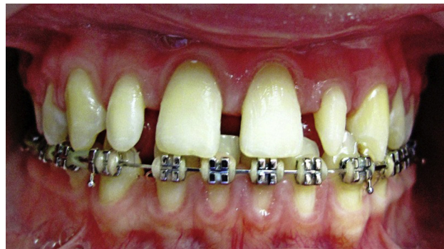
Figura 1 Foto inicial. Diastemas en maxilar superior y laterales en forma de clavija.

En la fase clínica, una vez seleccionadas las preformas, se fueron probando una a una en los dientes correspondientes y, posterior a esto, se procedió a hacer la desmineralización del esmalte de los respectivos dientes con ácido ortofosfó-