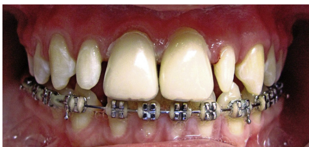
Figura 2 Preformas plásticas cargadas con resina y adaptadas en centrales.