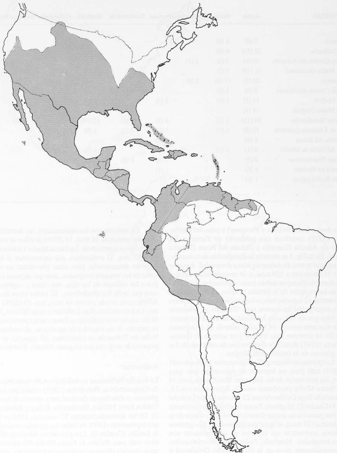
FIGURA 1. Distribución de la familia Agavaceae.