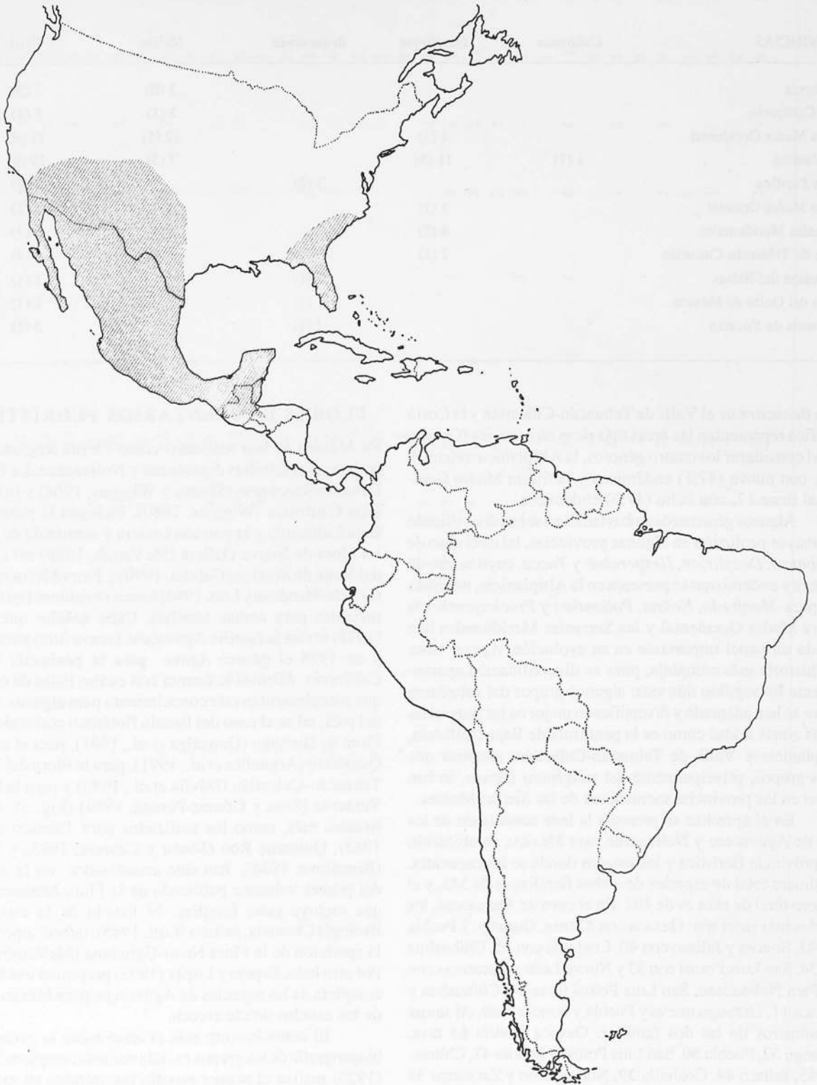
FIGURA 2. Distribución de la familia Nolinaceae (modificado de Hernández, 1993).