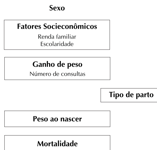
Figura 2 - Modelo de análise para mortalidade neonatal precoce.

A Tabela 2 mostra os coeficientes de mortalidade fetal, neonatal precoce e perinatal para as mulheres múltiparas e primíparas, com as respectivas razões de “odds” e intervalos de confiança de 95% , ajustados conforme os níveis hierárquicos. O sexo masculino apresentou maior risco para a mortalidade neonatal precoce e perinatal sendo o coeficiente neonatal precoce cerca de duas vezes maior (15,1/1.000) para o sexo masculino do que para o sexo feminino (8,2/1.000). As variáveis socioeconômicas - escolaridade e renda familiar - mostraram uma razão de “odds” bruta significativa para a mortalidade fetal (0,01 e 0,08, respectivamente), neonatal precoce (0,08 e 0,05, respectivamente), e perinatal (0,002 e 0,002, respectivamente). Ao controlar renda para escolaridade e vice-versa, o efeito de uma é esvaziado pela outra, embora sempre uma delas permaneça associada significativamente com os diferentes componentes da mortalidade (Tabela 2). Os coeficientes de mortalidade também mostram a mesma associação significativa com as variáveis socioeconômicas, sendo que o coeficiente de mortalidade perinatal foi cerca de 2,5 vezes maior para as crianças de famílias de baixa renda e pouca escolaridade.