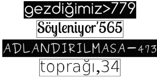
Şekil 3: Üretilen sentetik Türkçe metin imgelerinden örnekler.

mevcuttur. Bu sayede, test imgelerinden çıkarılan ÖDÖD noktaları için eğitim kümesindeki yaklaşık en yakın komşuluklar bulunduğu ve noktalar ile ilgili çıkarım yapılabildiği. Elde edilen sonuçlar Tablo II'de verilmiştir.