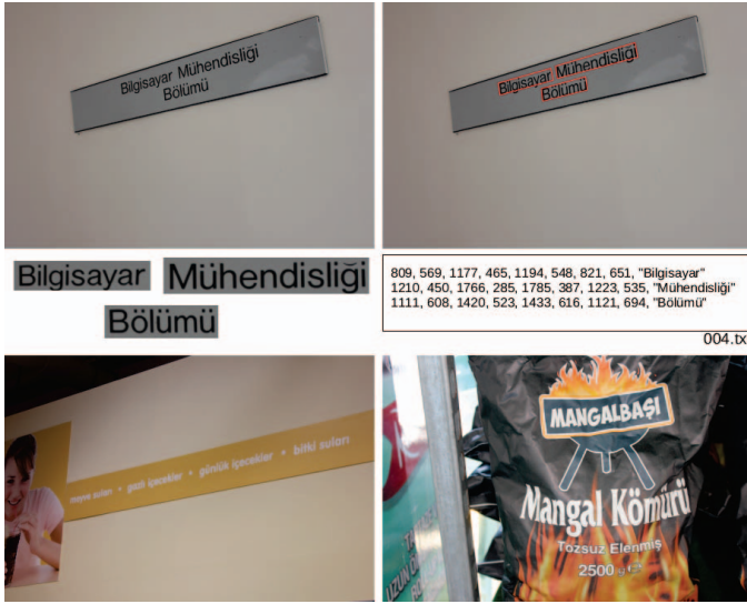
Şekil 1: STRIT veri kümesinden örnek imge ve veriler. Üstte: Orjinal bir manzara resmi ve üzerine metin kutucuğu işaretlenmiş hali. Ortada: Manzara imgesinden kırılmış metin imgeleri ve metin konum ve çevriyazı gerçek referans değerlerinin kaydedildiği doküman. Alttı: Veri kümesinden iki örnek daha.

İkinci fark olarak, sınırlayıcı dörtgenler işaretlenirken tiyografi elemanları dikkate alınmıştır. ICDAR veri kümelerinde olduğu gibi bu işlem için çoğunlukla benimsenen yaklaşım bir kelimenin tüm harflerinin tüm parçalarını içine alan en küçük dikdörtgeni seçmektir. Ancak bu yaklaşım beraberinde bir dezavantaj getirmektedir: Kelimelerin içinde yer alan harflere göre her harfin tek başına sınırlayıcı bir kutucuk içindeki konumu kelimedenden kelimeye değişebilmektedir. Örneğin, bir kelimenin işaretlenmesi içinde alt çıkıntıya taşan parçaları olan "y", "p"; ya da üst çıkıntıya taşan parçaları olan "S", "k" gibi karakterler barındırıp barındırmamasına göre farklılık gösterecektir. Bu belirsizliği ortadan kaldırma amacıyla, STRIT veri tabanında kelimedede yer alan harflerden bağımsız olarak sınırlayıcı kutucukların alt kenarı için taban çizgisi, üst kenarı içinse görünen ya da tahmini üst çıkıntı yüksekliği temel alınmıştır. (Şekil 2)