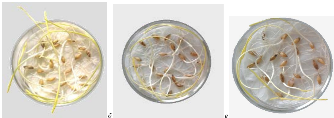
Рис. 1. Вплив культуральних рідин мікроміцетів-антагоністів на проростання насіння ярого ячменю:

Отцінюючи потенціал мікробів-антагоністів фітопатогенів, слід враховувати вплив їх метаболітів на ріст і розвиток рослин. Із цією метою визначають фітотоксичність культуральних рідин цих мікроорганізмів. Нами досліджено вплив найактивніших штамів мікроміцетів T. longibrachiatum 17 та T. lignorum 14 на ростові показники ярого ячменю сорту «Кристалія». Порівнювали довжину коренів і листків у проростків насіння, обробленого культуральними рідинами мікроміцетів у розведенні 1 : 10, з морфометричними показниками контрольних проростків, оброблених стерильною водою. За даними Horshchar (2013) токсичними вважають культури, які пригнічують ріст пагонів і коренів на 30% і більше порівняно з контролем.