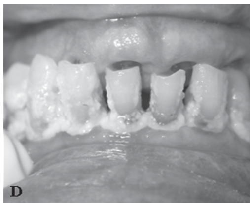
Figura 5. Estado clínico da cavidade bucal de idosa com 91 anos.

Dentista? Pra quê? Já não tenho dentes mais. Não tem nem porque ir agora. (sexo feminino, 88 anos, autopercepção positiva)