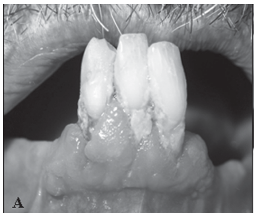
Figura 1. Estado clínico da cavidade bucal de idoso com 92 anos.

Precisar preciso (ir ao dentista), mas é difícil, estou esperando para ver se minha sobrinha me leva. Para mim tudo é difícil, minha sobrinha custa vir aqui ... o consultório dela está cheio, não pode ficar parando para vir aqui... (sexo feminino, 88 anos, autopercepção negativa, tia de dentista)