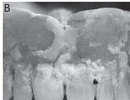
Figura 6. Estado da prótese utilizada por idoso com 70 anos.

A conformação e a falta de esperança são elementos presentes na grande maioria dos espaços institucionais brasileiros 40 . De alguma forma estes indivíduos passam a ter valores sociais diferentes. A maioria, não parece se abater ou mesmo se indignar com precárias condições bucais e nem mesmo com as limitações conseqüentes destas condições. Os que gostam de cantar, conversar, sorrir, não vão deixar de fazer isso se tiverem à oportunidade, porque não têm dentes, ou porque a prótese balança. Eles se sentem inertes,