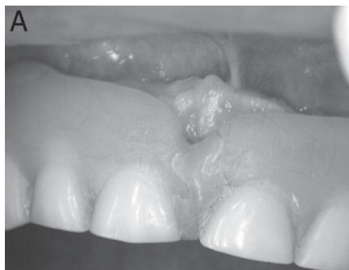
Figura 2. Estado clínico da cavidade bucal e da prótese utilizada por idosa com 76 anos.