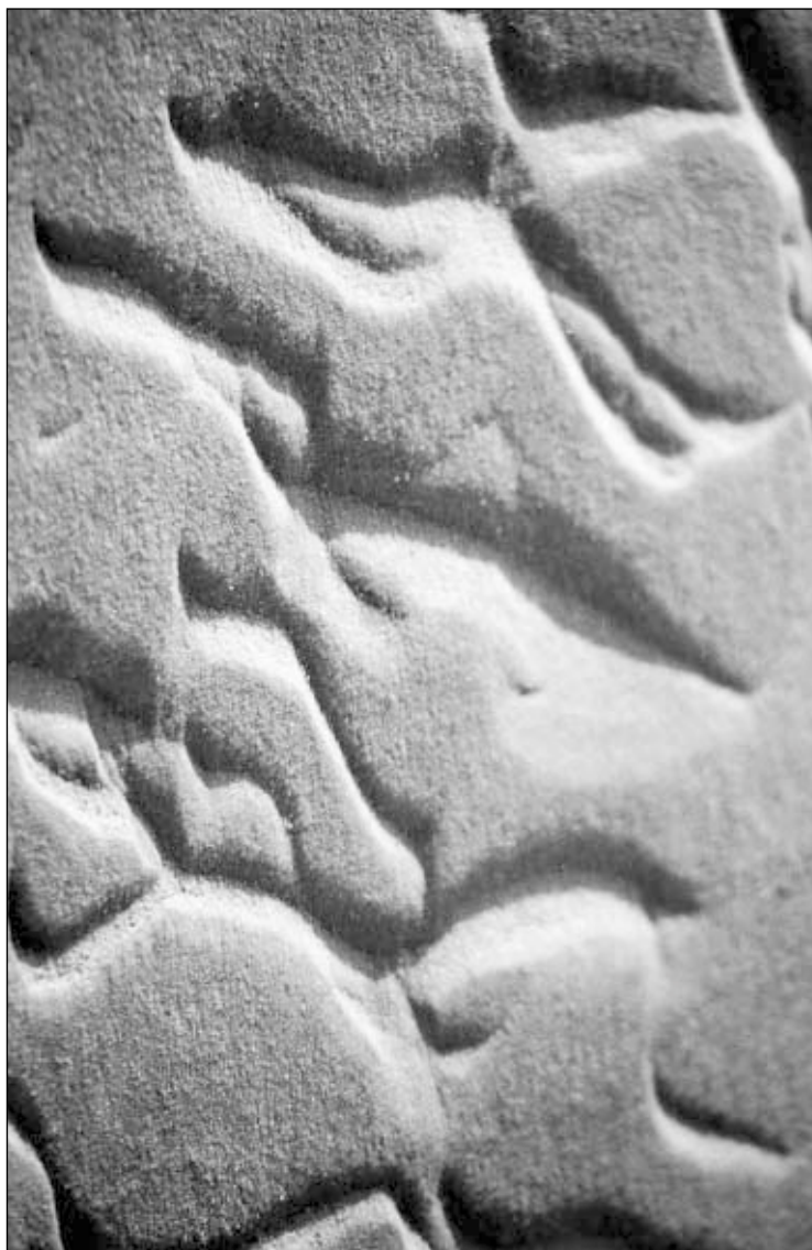
Desenhos Areia - Caburé - MA