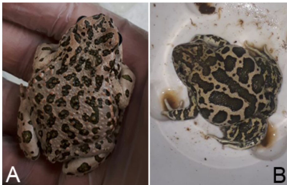
شکل ۱- تصاویر وزغ‌های بررسی شده در این مطالعه. A. وزغ سبز اروپایی ( Bufo viridis ). B. وزغ پایبلچه ای ( Pelobates syriacus ). Fig. 1. Photographs of toads investigated in this study. A. European green toad ( Bufo viridis ). B. Eastern spadefoot toad ( Pelobates syriacus ).