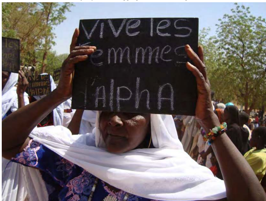
Photo 5.3 Les femmes hadjaraye se sont appropriées la technologie de savoir lire et écrire