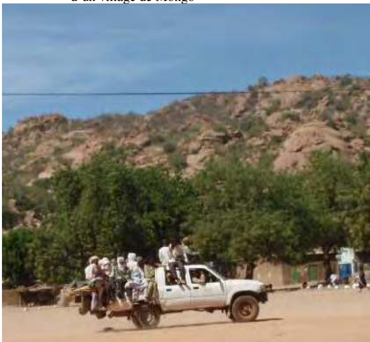
Photo 1.1 Un véhicule se rendant sur un marché hebdomadaire d'un village de Mongo

l'activité des 'coupeurs de routes', bandes armées au comportement souvent violent en raison notamment d'un fréquent usage de stupéfiants. 14