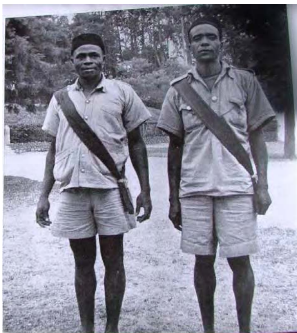
Photo 6.1 Two messengers in their official outfits