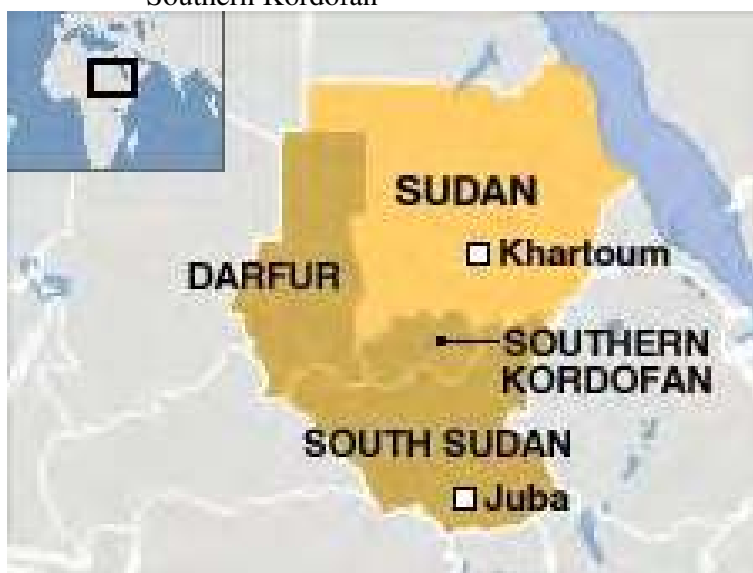
Map 9.1 Map of Sudan and South Sudan, showing Southern Kordofan

In contrast, the urban migrant youth that are the subject of this chapter come from one such ‘peripheral’ place that covers an area of approximately 250 km by 165 km (12°00’N and 30°45’E) to the southwest of Khartoum. Such a geographic location formulation is not the term of preference for the place now commonly known as the Nuba Mountains, al-jibaa al-nuba . In geo-political terms, the Nuba region is situated in the geographic centre of the country, politically incorpo-