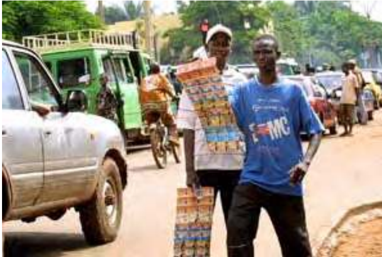
Photo 7.1 Si chaque société de téléphonie tient jalousement à ses produits et concepts l'espace public Bamakois est assez clairsemé de nombreux bricolages autour des usages de la téléphonie mobile. L'expression achevée de ces bricolages est la figure des vendeurs ambulants de cartes de recharger