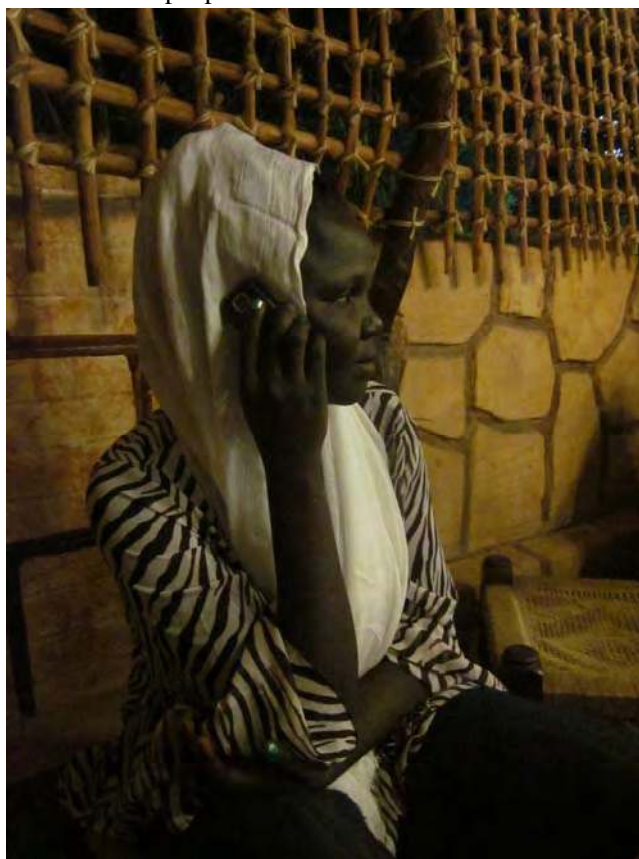
Photo 9.1 Nuba University student talking with people from the mountains

Nuba university students who have migrated to Khartoum are a marginalized group faced with the practical realities of participating in mainstream Sudanese life. On the one hand, they have a new urban consciousness where, when sitting in a lecture hall with hundreds of other students, one’s place of origin is less meaningful. On the other hand, as they make contact with the dominant culture,