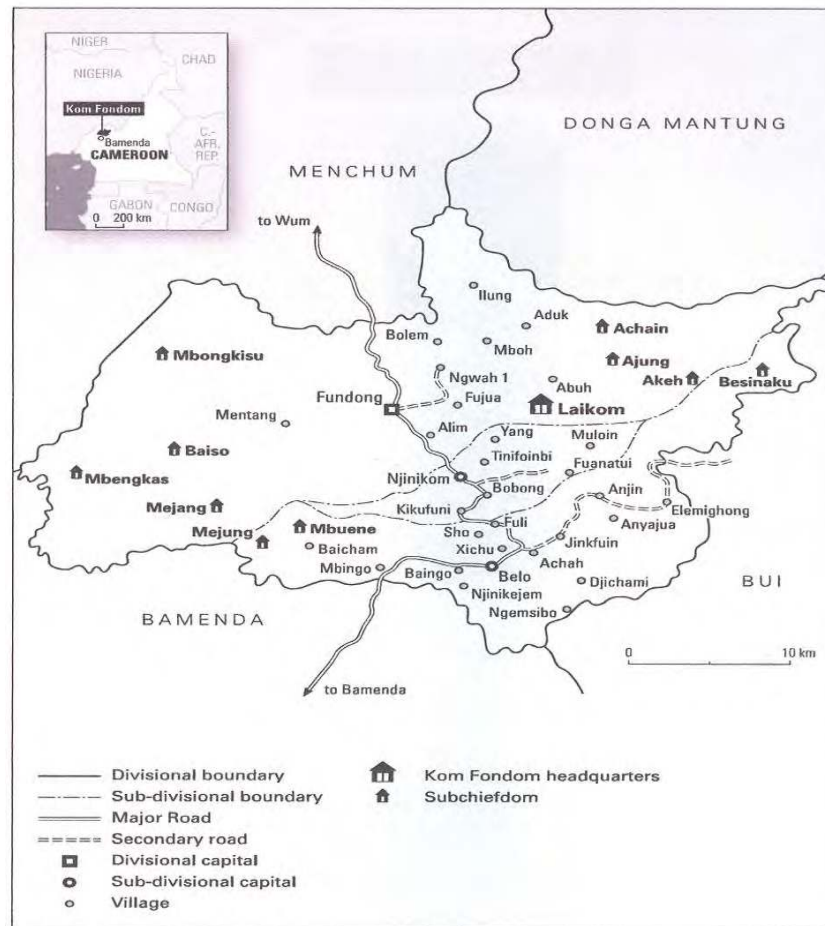
Map 6.2 Kom Fondom showing its neighbours, villages and sub-chiefdoms