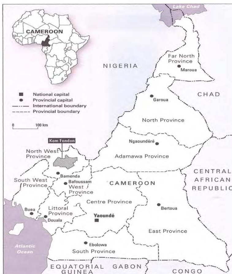
Map 6.1 Bamenda grassfields showing the location of Kom