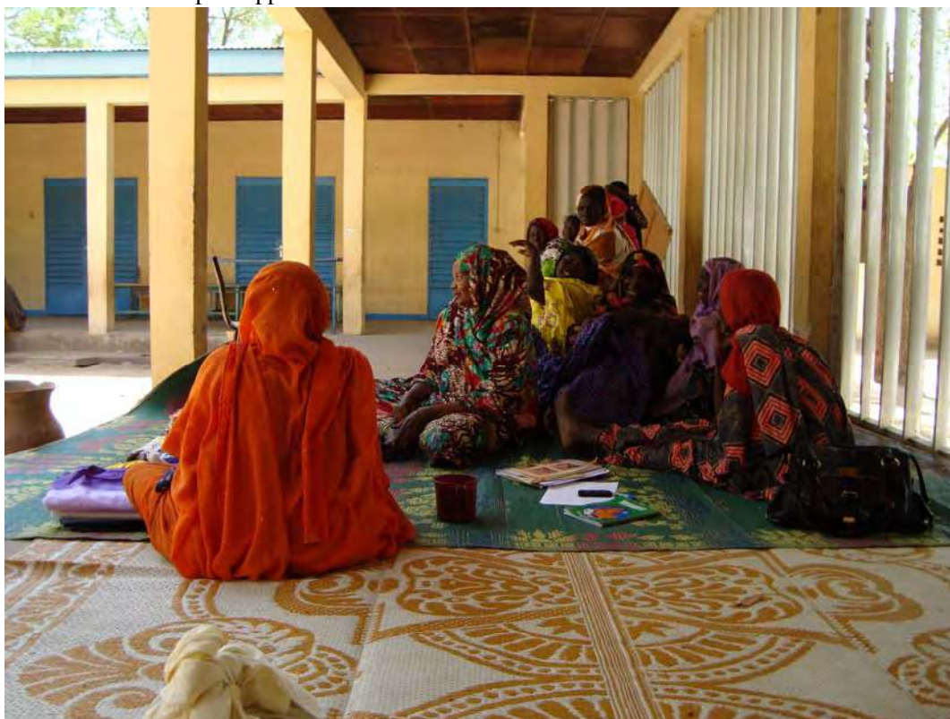
Photo 5.1 Le temps d'apprendre est arrivé