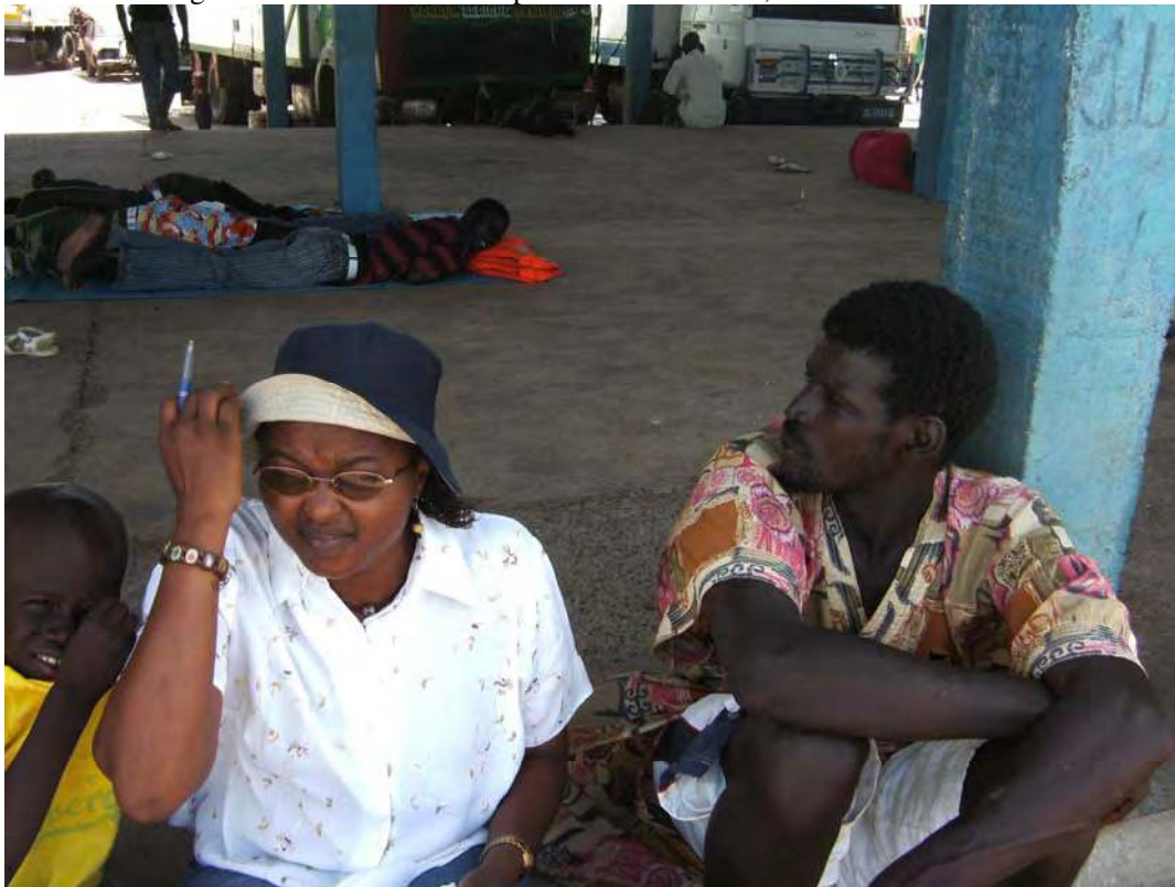
Photo 8.1 Migrant who returned from Spain due to ill health, St Louis

This connectivity is not limited to migrants and their family or to migrants' associations and their homeland but has also extended to the political arena. Through migrants' trans-connections, families at home are able to speed up or influence political decisions. When Moustapha and a host of other boat migrants were stranded in Morocco and news of their maltreatment reached their families, the latter were able to mobilize support on their behalf to get the government to facilitate their return home. According to Moustapha, some migrants had their