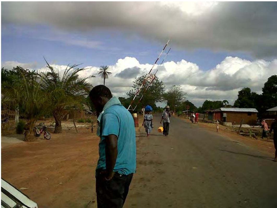
Photo 2.1 Un jeune homme se retire pour passer des coups de fil alors que la voiture qui le transportait est contrôlée par policiers au niveau de la frontière entre le Sénégal et la Guinée-Bissau (Mpack).

Pour une meilleure compréhension d'une telle stratégie, nous allons essayer de revenir sur la cause réelle et objective de la marginalité et la façon dont elle est perçue par les acteurs, avant de nous interroger sur certains développements lointains et récents liés aux possibilités qu'offrent les technologies de l'information et de la communication en termes de réduction de la marginalité.