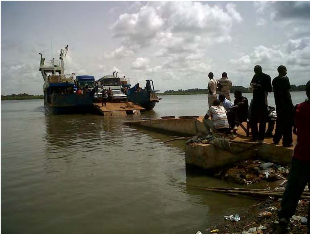
Photo 2.2 Des voyageurs quittant la Casamance pour se rendre dans d'autres régions du pays attendent des heures le bac à Farenni pour traverser le fleuve en territoire Gambien

tout simplement exercer une mobilité est davantage problématique pour les zones marginales comme la Casamance. Cette mobilité passe de plus en plus par le biais des infrastructures de communication et d'information.