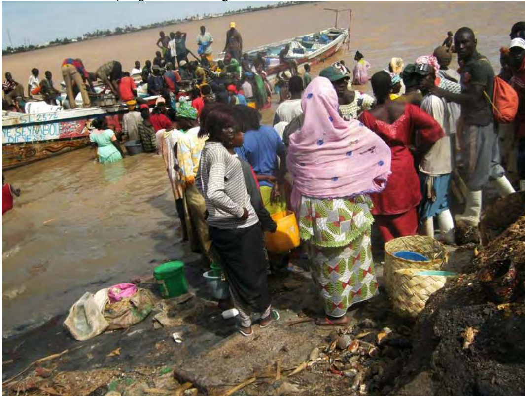
Photo 8.2 Return pirogue from fishing, St Louis