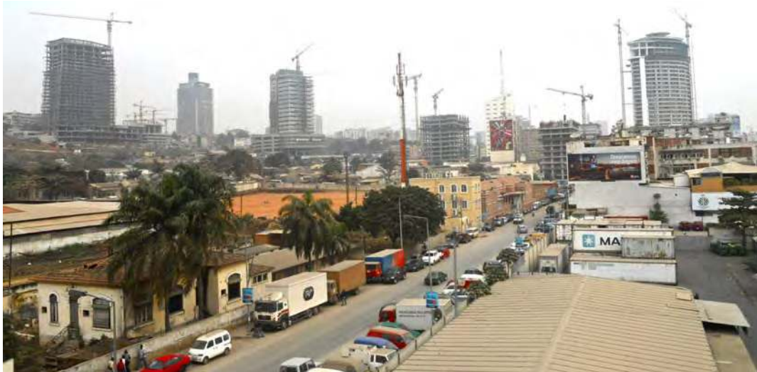
Photo 3.1 Luanda skyline in 2010

excited about returning to Luanda for the first time in ten years. When I asked him in earlier conversations about returning to a largely 'unknown' country, he was somewhat ambivalent: