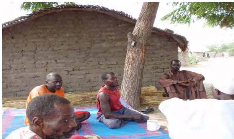
Photo 1.3 Une assemblée d'hommes attendant un appel téléphonique

toute la journée, les gens sont en état d'alerte: Les téléphones sont suspendus soit à un arbre, soit accrochés à une botte de paille. Durant toute la séance de causerie sous l'arbre à palabre, l'attention semble être plus portée à cet objet, comme c'est le cas de l'image ci-dessus.