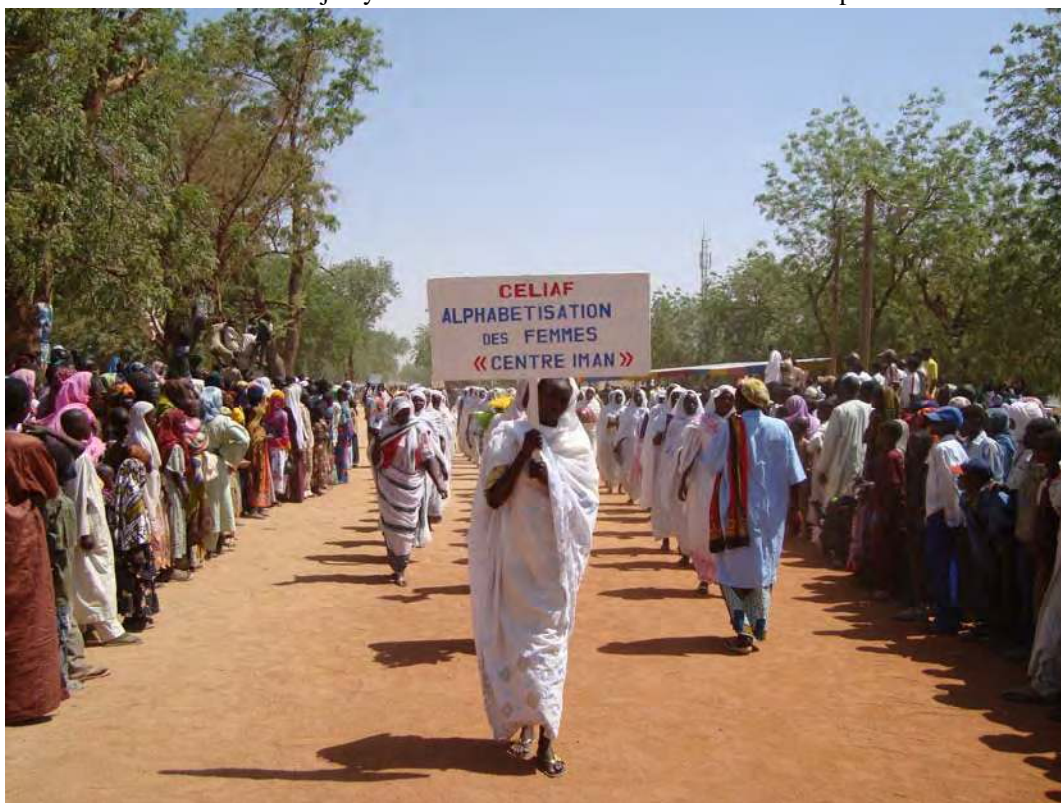
Photo 5.2 Les femmes hadjaraye ont décidé de faire face au défi de l'analphabétisme

liberté des structures féminines et de leurs membres. C'est ainsi que chaque association, chaque groupement a pris le soin de créer une composante alphabétisation au sein de son organisation pour former ses membres. A part la volonté de se libérer de la tutelle masculine, les motifs et pratiques d'alphabétisation observés varient largement selon les organisations. Les motifs vont de la simple possibilité accordée aux femmes d'apprendre à lire, à écrire et/ou à calculer, à la maîtrise des outils de gestion organique ou comptable de leurs organisations respectives.