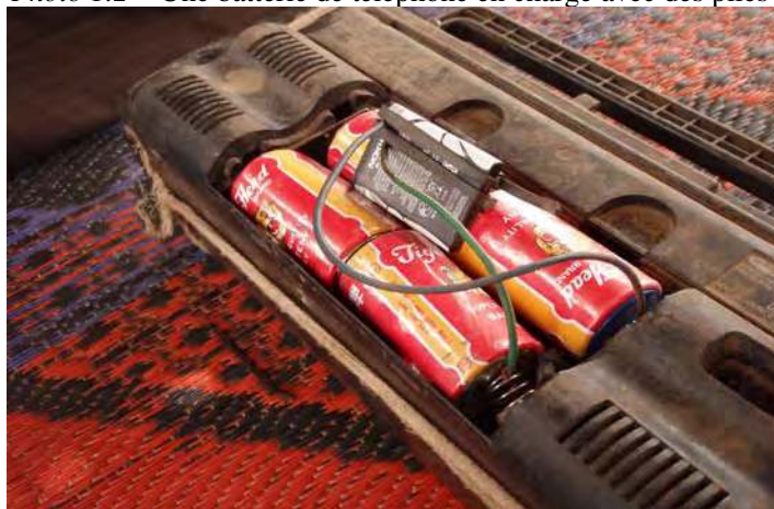
Photo 1.2 Une batterie de téléphone en charge avec des piles

dépôt de réseau limité et capricieux: Téléphones accrochés aux branches d'arbres ou aux toits des cases pour capter le réseau, charges des batteries avec des piles à défaut d'électricité et de générateurs.