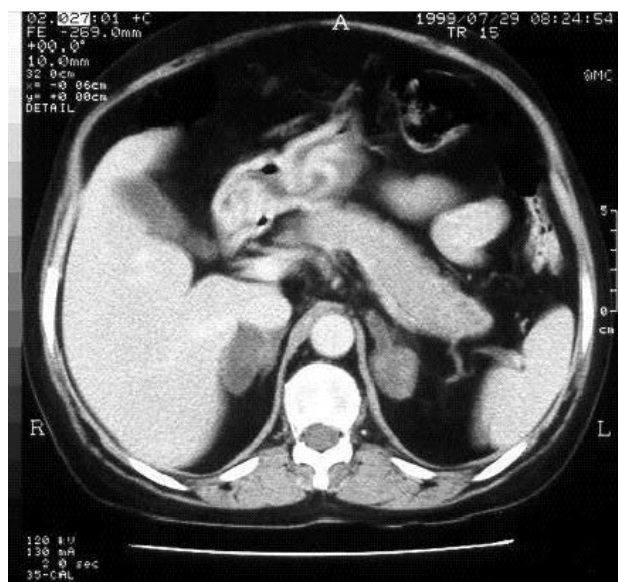
Figura 1. Tomografia computadorizada das adrenais de paciente com Síndrome de Cushing independente de ACTH: aumento nodular bilateral das adrenais.

O exame microscópico das adrenais revelou que os nódulos eram compostos por células claras, aparentemente com gordura, que apresentavam monotonia nuclear, características típicas das células do córtex adrenal. Chamava a atenção a presença de pequenas ilhotas de células compactas no meio dessa população de células claras, que possuíam núcleo mais vesiculoso e nucléolo proeminente, dados indicativos de maior replicação ou maior atividade de síntese celular (figura 2). Verificamos que o tecido internodular se apresentava hiperplásico, nas duas adrenais. O estudo imunohistoquímico da cortical, que nós temos realizado sistematicamente a partir de