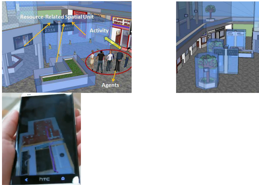
Figuur 3: Voorbeelden van een onderverdeling van de ruimte met gebruik van parameters van hulpmiddelen (links en in het midden) en het navigatieresultaat op een mobiele telefoon die het indirecte beeld van het gebouw weergeeft (rechts, Xu et al, 2013).

Wij zullen de gebruikersperceptie van de ruimte toepassen (Hall, 1969; Junstrand et al, 2001; Nakauchi en Simmons, 2002; Schefflen, 1975) en verder is 'aantrekkelijkheid' van de objecten van belang. We hebben een raamwerk ontwikkeld waar onderscheid gemaakt wordt tussen agents (mensen en menselijke proxies), die acties uitvoeren om hulpmiddelen te benaderen. De agents, acties en hulpmiddelen kunnen beïnvloed worden door modificaties (d.w.z. gebeurtenissen die de status van elke van de drie kunnen wijzigen). Modificaties kunnen noodsituaties, zoals vuur of rook, zijn (Zlatanova et al, 2013). Onze eerste onderzoek geeft aan dat hulpmiddelen een aantal karakteristieken kunnen bevatten (functie, aantrekkelijkheid, tijd, toegang, aantal agents, sociale afstand, etc.). Deze eigenschappen worden gebruikt om een ruimte rond de hulpmiddelen toe te kennen, die gebruikt kunnen worden voor het lokaliseren van agents, maar niet gebruikt kunnen worden om door andere agents te navigeren. Deze ruimten bakenen de mogelijke begaanbare ruimte (d.w.z. de ruimten die buiten de ruimten voor hulpmiddelen vallen zoals in Figuur 3 aangegeven). Door het ontwikkelen van een juiste grammatica om deze criteria te gebruiken kunnen de ruimten rond hulpmiddelen dynamisch worden gewijzigd. Zo kan bijvoorbeeld het gebied rond een koffiehok verschillende meters zijn gedurende de koffiepauze en slechts een meter als er geen koffiepauze is.