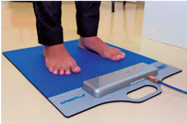
Figura 1. Paciente posicionado para mensuração e coleta de dados de baropodometria eletrônica estática.