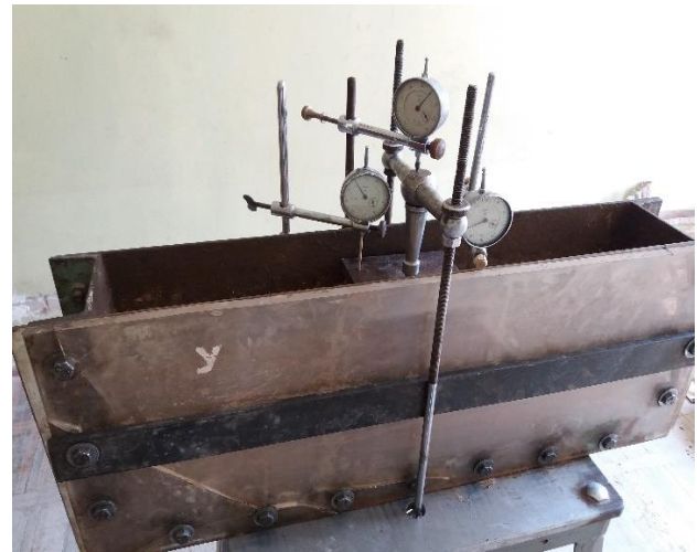
Fig. 1. Model of soil bank in trough with measuring devices.

loaded the tested model fixing the readings of the measuring devices.