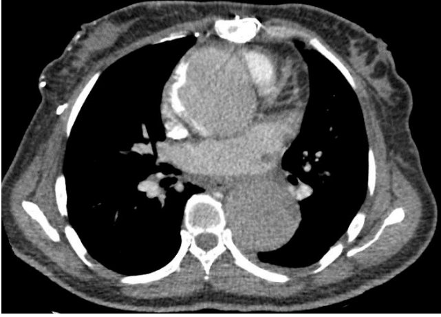
Çizim 3. Aort anevrizması görünümünün bilgisayarlı tomografi aksiyal kesiti