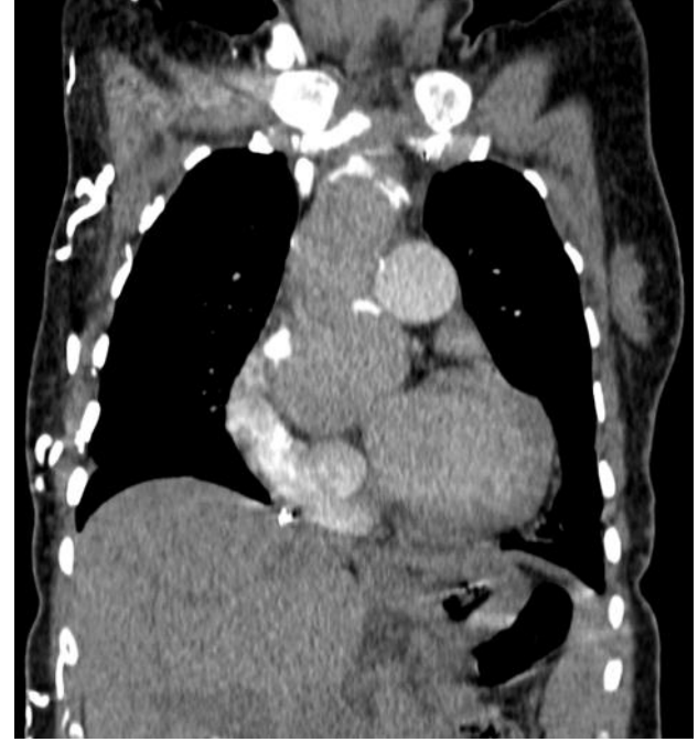
Çizim 1. Aort anevrizması görünümünün bilgisayarlı tomografi koronal kesiti

bulduğu konsey ekibi tarafından hastaya gebeliğin yüksek riskli olduğu bildirildi. Hastanın terminasyonu talep etmesi üzerine 15 hafta 3 günlük gebeliği olan hastaya terminasyon kararı alındı. Hastaya 3 saat aralıklarla 400 mcg vajinal prostoglandin E1 (misoprostol) verildi, yaklaşık 12 saatte vajinal muayenede ilerleme olmaması üzerine hastaya servikal balon dilatasyon yapıldı. Tedaviye başlandığı 15. saatte abortus meydana geldi. Abortus sonrası rest plasenta görülmesi üzerine bumm-küretaj ihtiyacı oldu. Bumm-küretaj sırasında hasta 10Ü intramüsküler (IM) oksitosin enjeksiyonu yapıldı. İşlem öncesinde hastaya profilaktik 1 gr ampicilin intravenöz uygulanıp, işlem sonrası ve taburculuğunda doksisisiklin 100 mg 12 saatte bir kullanım için reçete edildi. Hastanın preoperatif ve postoperatif vital takibi ve hemodinamisi normal sınırlarda seyretti.