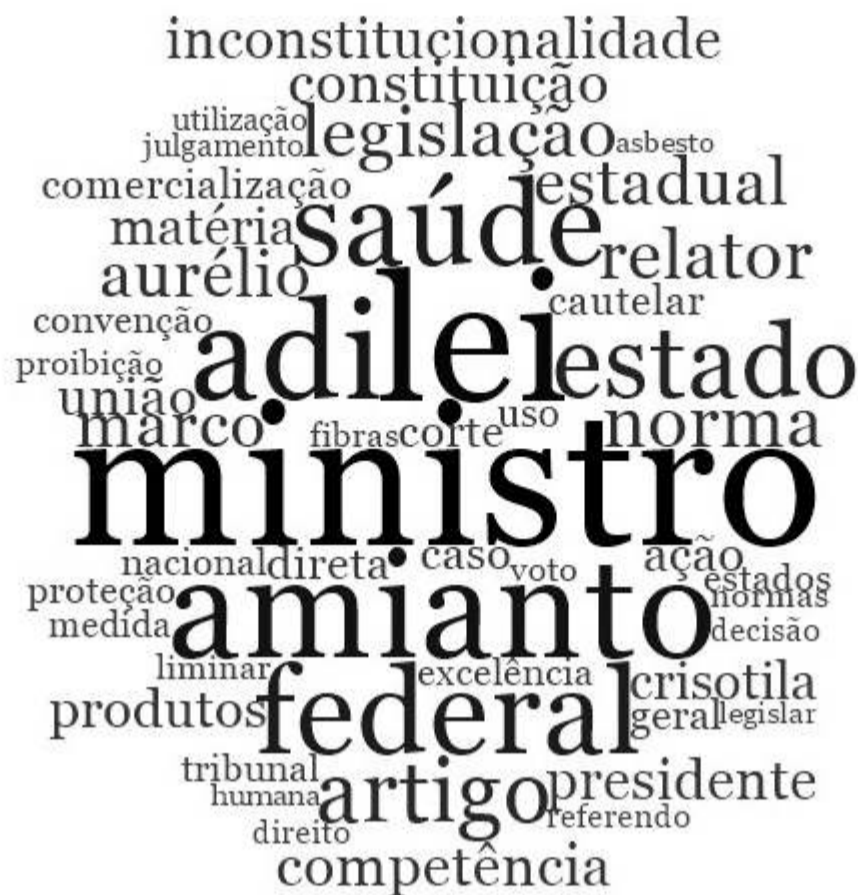
FIGURA 7 – NUVEM DE PALAVRAS DE MAIOR VINCULAÇÃO E REPETIÇÃO NO UNIVERSO DOS VOTOS E NOTAS TAQUIGRÁFICAS E VÍDEOS

Fonte: elaborado pelo autor com o software NVivo a partir de dados da pesquisa.