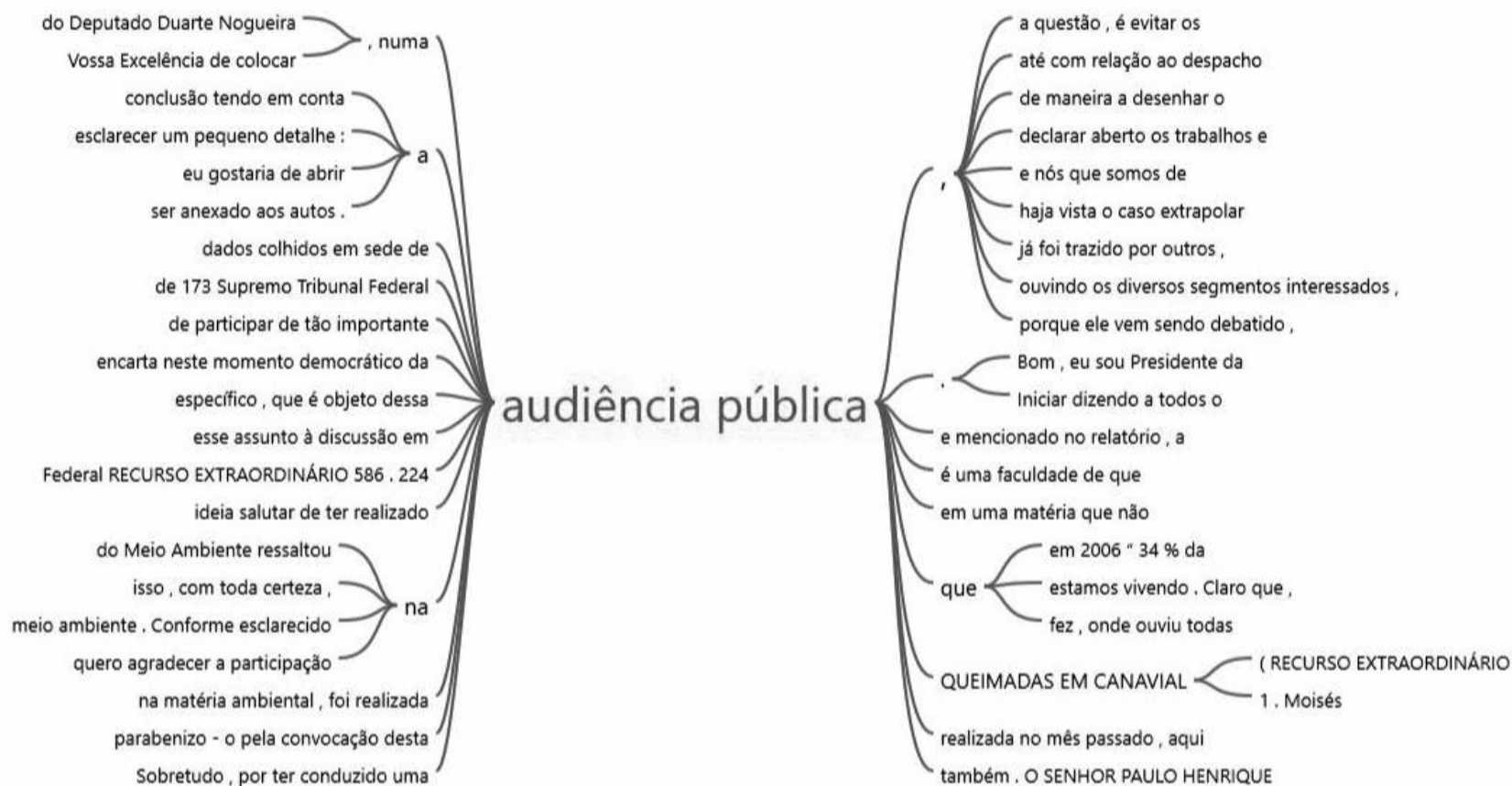
FIGURA 2 – GRÁFICO DE RAIZ COM AS EXPRESSÕES DE MAIOR INCIDÊNCIA RELACIONADAS AO TERMO “AUDIÊNCIA PÚBLICA”